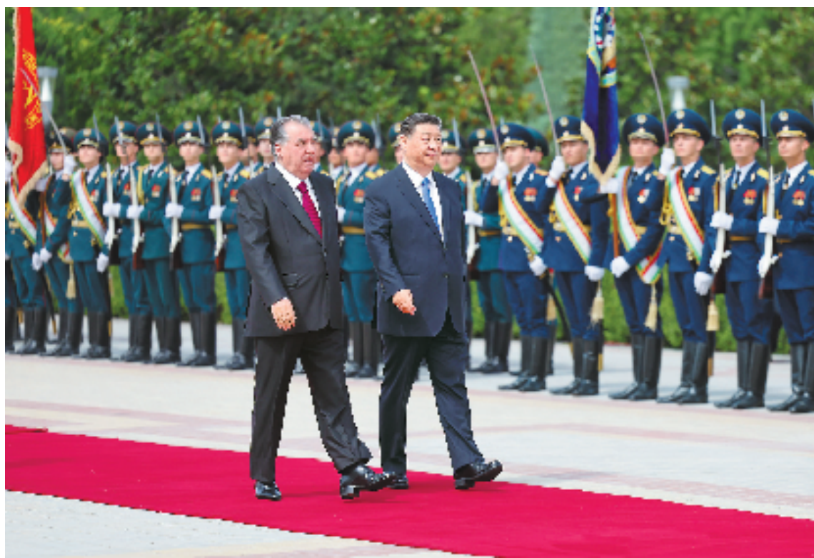
当地时间7月5日下午,国家主席习近平同塔吉克斯坦总统拉赫蒙在杜尚别总统府举行会谈。拉赫蒙为习近平举行盛大隆重的欢迎仪式。这是习近平在拉赫蒙陪同下检阅仪仗队。