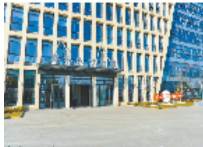
安吉孝源街道青年人才社区

青年人才的人驻,为安吉的乡村发展带来了更大的想象空间。安吉在产业融合、城镇规划、人才聚集等方面一起发力,推动资本、资源、人才深度融合,打造青年人才创新创业新路径,让原乡人、新乡人、归乡人、旅乡人形成价值认同,让安吉乡村成为青年人才记得住乡愁的温馨港湾。