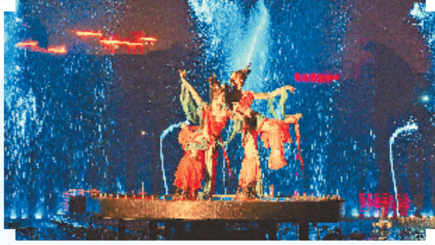
“和合天下 心归天台”始丰湖大型行浸式夜游

距离浙江定下打造“旅游经济强省”战略目标已经20年。天台县委、县政府以“绿水青山就是金山银山”理念引领，秉持“文旅兴县”战略不动摇，跟着因地制宜的发展蓝图一任接着一任干，紧扣文旅现代化、大众化市场需求，持续深挖本土文旅资源，培育个性文旅品牌，打造精品文旅路线。“2024年全国县域旅游综合实力百强县”名单近日在京公布，天台县位列22名，连续3年进入全国30强。