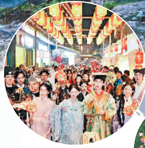
济公故里 赭溪老街