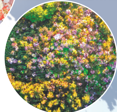
华顶国家森林公园

思维”为核心，坚持“无运营不旅游”。赭溪老街以前置监管、强化运营的模式，催化文旅融合新业态。在项目策划之初，天台与企业签订监管协议，明确建设及配建内容、业态配比，要求企业对自持商铺统一招商、统一运营、统一管理，按照“一坊两街六组团”精准布局文旅业态，进一步增强老街的可持续发展。