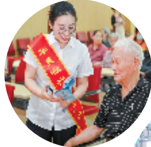
为老年客户送上暖心服务

华夏银行杭州分行还推出了“浙家惠”公众号、视频号等载体,打造“互联网+金融+产业+生活场景”的金融服务生态圈,与消费者共赴美好生活。