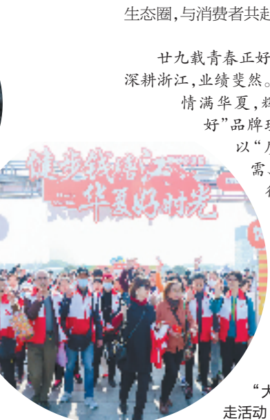
“大美浙江行”健步走活动