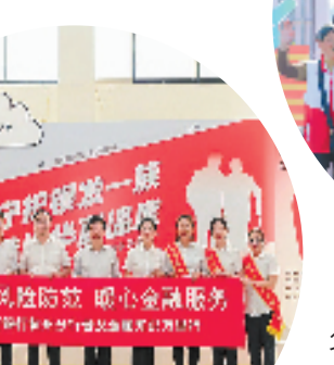
“普及金融知识万里行”父亲节特别活动