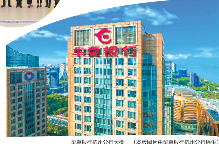
华夏银行杭州分行大楼