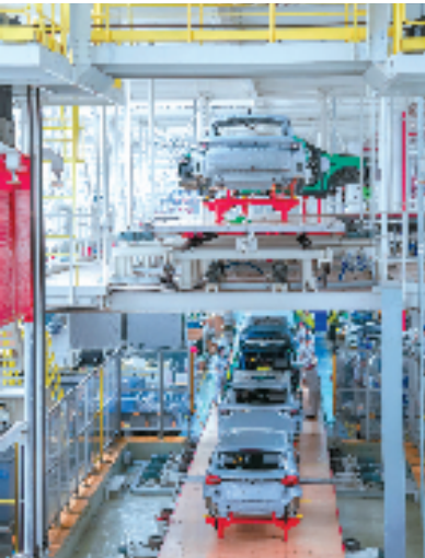
华夏银行杭州分行为新能源汽车企业提供金融支持

让金融之“血”融入现代产业之“躯”,华夏银行杭州分行聚焦浙江加快打造世界级先进制造业集群,持续提升全生命周期金融服务能力,全力支持“专精特新”中小企业、高新技术企业、战略新兴产业等加速成长。截至今年一季度末,该行科创企业贷款总量139.1亿元,比年初增长3.6亿元。