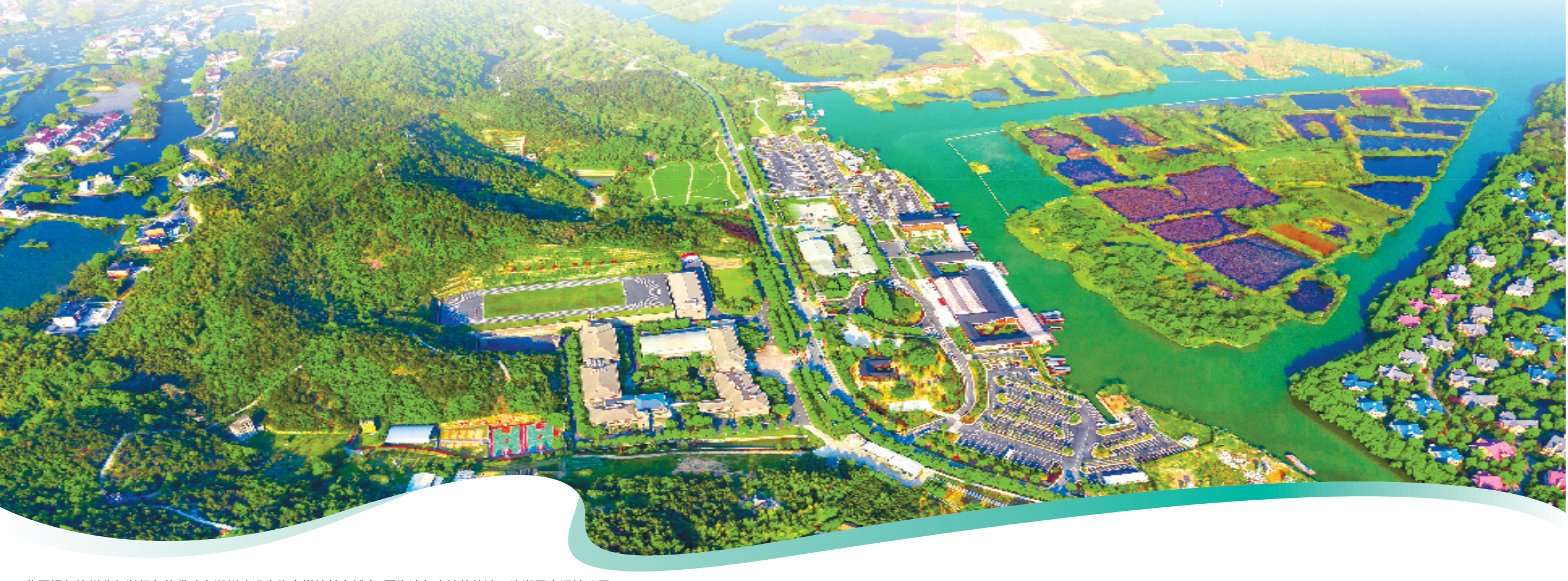
华夏银行杭州分行以绿色信贷助力湖州建设生物多样性魅力城市,图为该行支持的德清下渚湖国家湿地公园。

6月28日,华夏银行杭州分行迎来了成立29周年的重要时刻。二十九年扎根于浙江这片激荡着无限创新活力的热土,华夏银行杭州分行认真贯彻落实浙江省委、省政府、监管部门及总行的决策部署,聚焦国家战略,解答时代命题,回应民生需求,始终坚持金融服务实体经济的根本宗旨,饱蘸“高质量”笔墨,寻“新”求“质”,大笔如椽把科技金融、绿色金融、普惠金融、养老金融、数字金融“五篇大文章”书写在之江大地上,在高质量发展中奋力助推浙江“两个先行”,充分展现“华夏担当”。