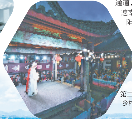
第二届“越湖州 越有戏”乡村越剧联赛比赛现场