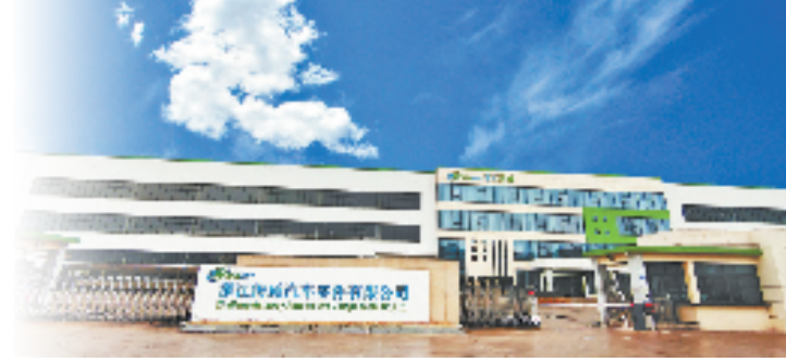
浙江海威汽车零部件有限公司

今年，湖州将加快研究推进诸峰高速建设，完善城市东西向路网、扩宽义甬舟大通道，加快“融杭”进程；研究推进余慈高速南延至湖州段建设，破解四明山天然阻隔难题，打造甬绍都市圈大环线，加快推进312省道建设，拓宽湖州至宁波通道，加快“联甬”步伐。