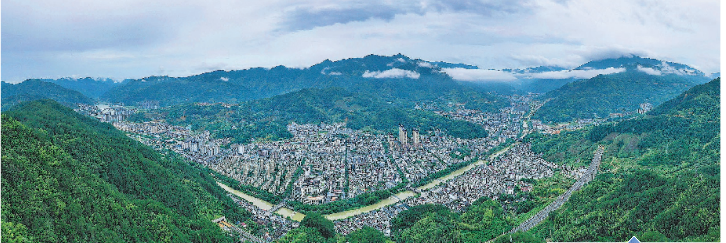
景宁畲族自治县新貌。

1984年,国务院批准设立景宁畲族自治县,成为全国唯一的畲族自治县、华东地区唯一的少数民族自治县。习近平总书记在浙江工作时,曾将景宁作为基层工作联系点,到中央工作后多次对景宁发展作出重要指示批示。