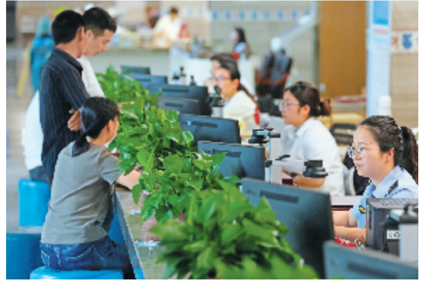
景宁畲族自治县持续推动“互联网+政务服务”工作,创新构建“一网通办”模式,政务服务一网通办率达99.69%。群众在景宁畲族自治县行政服务中心办理各种业务。