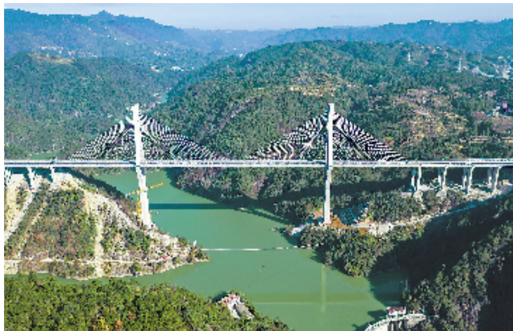
景宁畲族自治县以大手笔规划、大资金投入、大力度建设,推动全县交通事业全面发展,先后建成云景、景文高速公路,助力景宁加快融入长三角、海西经济区。图为2023年通车的景文高速公路。