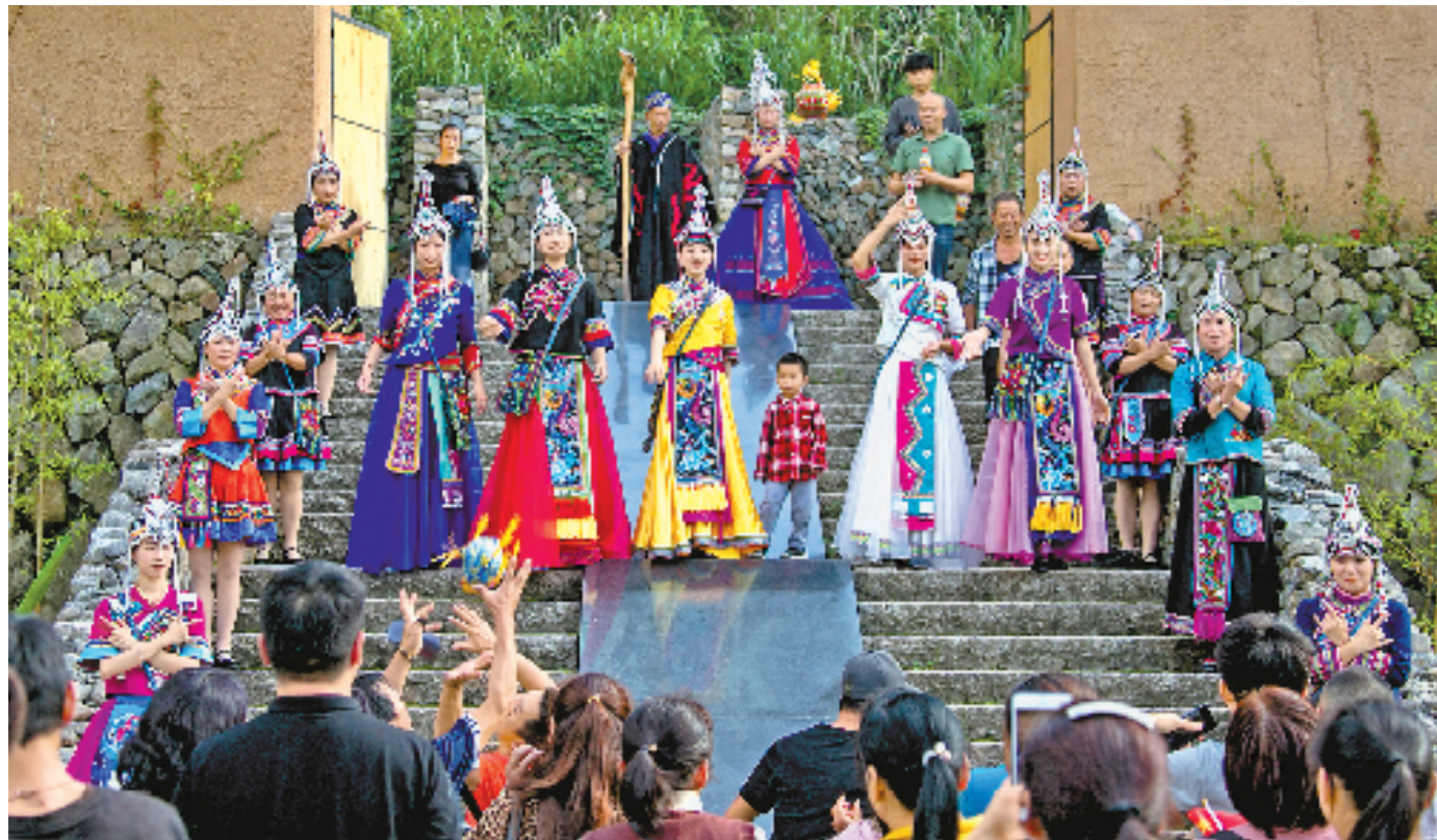
景宁畲族自治县掀起文旅“畲乡风”,跻身全国县域旅游综合实力百强县。40周年县庆期间,全县单周接待游客12万人次,实现营业收入1.1亿元。