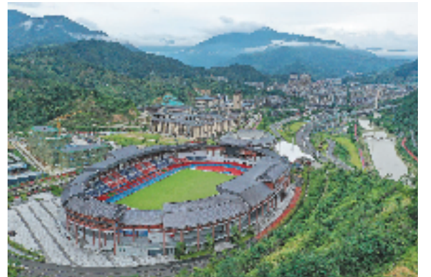
集篮球馆、足球场、气排球场、网球场等设施于一体的景宁体育公园,让群众多了一个健身锻炼的好去处。