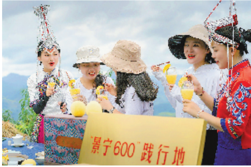
景宁畲族自治县创立“景宁600”区域公共品牌,逐步形成以惠明茶为主导,以高山果蔬、中药材为优势,以中蜂、地瓜面等为特色的农业产业体系。主播们在直播销售“景宁600”农产品。