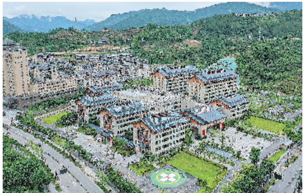
这些年来,景宁畲族自治县医疗卫生条件发生巨大改变,特别是2013年以来,县人民医院与浙江大学医学院附属第一医院结成帮扶对子,并挂牌为浙江省民族医院。