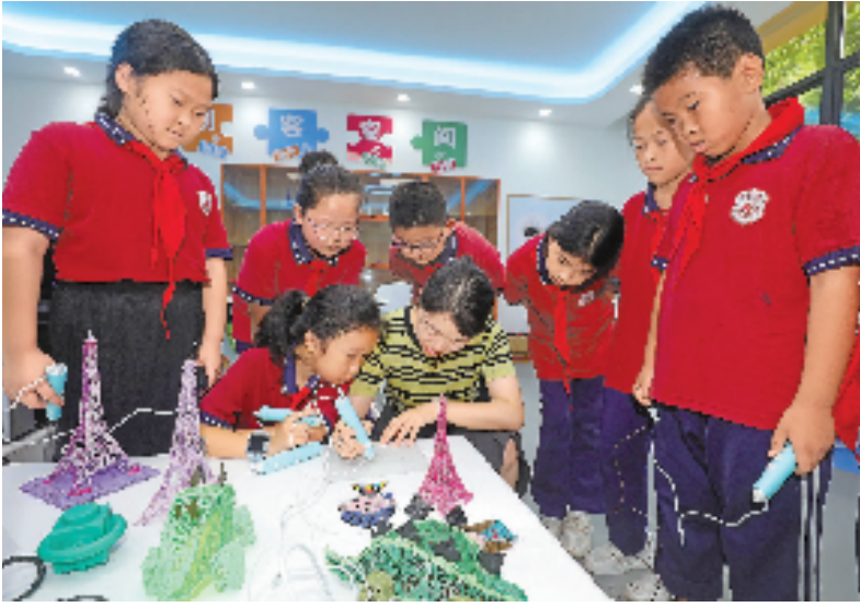
景宁畲族自治县加快推进义务教育优质均衡发展,扎实推动教育智能化转型升级。该县红星小学3D打印课堂上,老师在教导学生如何使用3D打印机。