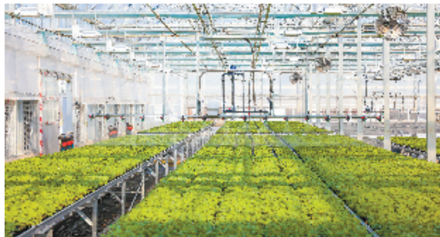
萧山“谢径安·传化农创村”数字种苗工厂

油菜花开的季节,京杭大运河北部的双桥村、戚家桥村、新宇村和杭信村游人如织。这四个村庄通过乡村风貌系统性改善工程,打造为大运河以北美丽乡村核心区,游客一天就能体验赏花、插秧、捕鱼、收菜等多种农事活动,美丽经