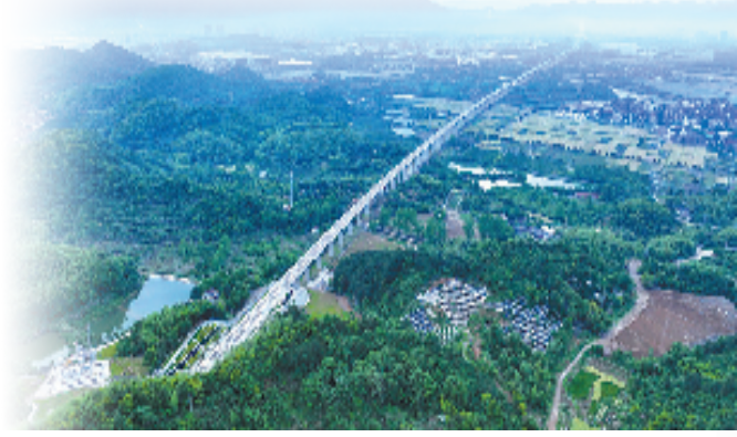
杭温高铁跨黄铁路特大桥航拍

2024年以来,浙江轨道集团累计完成客运量超1858万人次,各轨道运营线路正点率均达99.9%以上,收到表扬信2693件,乘客满意度不断提升。