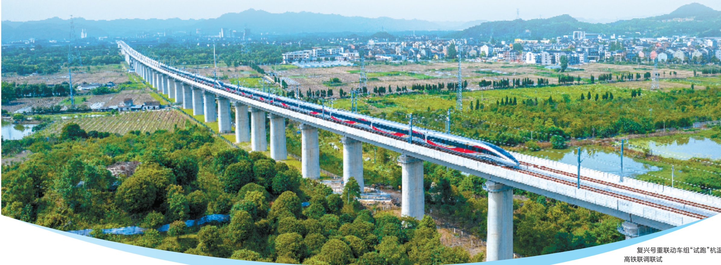
复兴号重联动车组“试跑”杭温高铁联调联试

打开轨道上的长三角想象空间,血脉奔腾的景象呼啸而来。 在湖州,“十字型”高铁网交通主动脉即将成型,湖州东站建成后,20分钟可达杭州、30分钟可达上海、45分钟可达南京,成为湖州加快融入长三角“半小时经济圈”的重要机遇和抓手; 在温州,城际铁路将都市圈同城化的交通毛细血管不断伸向“最后一公里”,长三角一体化的区域活力不断迸发; 在丽水、在舟山,山区县、海岛县因铁路建设打开了梦想的空间,长三角一体化交通基础设施互联互通一个都不能少…… 作为省交通集团旗下承担全省轨道交通统一运营、建设管理的重要平台,浙江轨道集团立足多层次、立体化的轨道交通网络,拓展内畅外联大通道,织密都市圈辐射网。