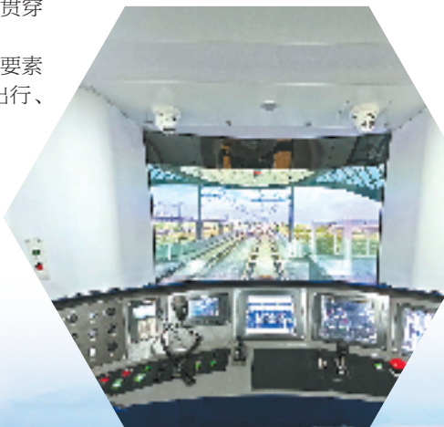
全仿真模拟驾驶室

就在今年,除了杭温高铁将具备通车条件,铁路湖州东站将具备开通条件外,衢丽铁路二期站前工程将全面开工,金建铁路全线隧道将实现贯通……“立足服务大局,我们将进一步提高站位,扛起政治责任,贯彻省交通集团统一部署,以深化开展‘实干攻坚年’活动为抓手,鼓舞和动员各指挥部全体员工以及全线参建者攻坚克难、担当作为,争当先行者、谱写新篇章。”浙江轨道集团党委副书记、总经理、浙江(交投)铁路建设总指挥部总指挥长言建标说。