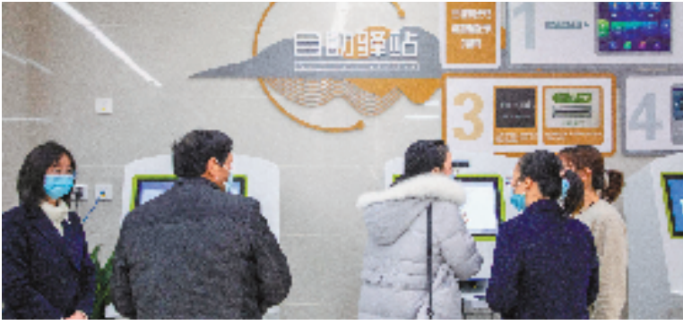
舟山人社工作人员引导群众和企业在线上办理业务(资料照片)。