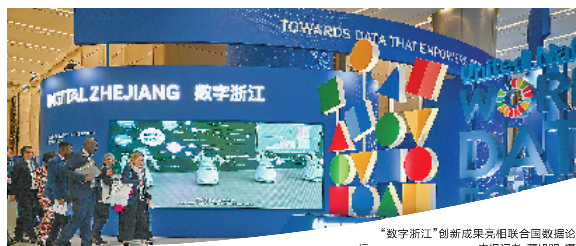
“数字浙江”创新成果亮相联合国数据论坛。