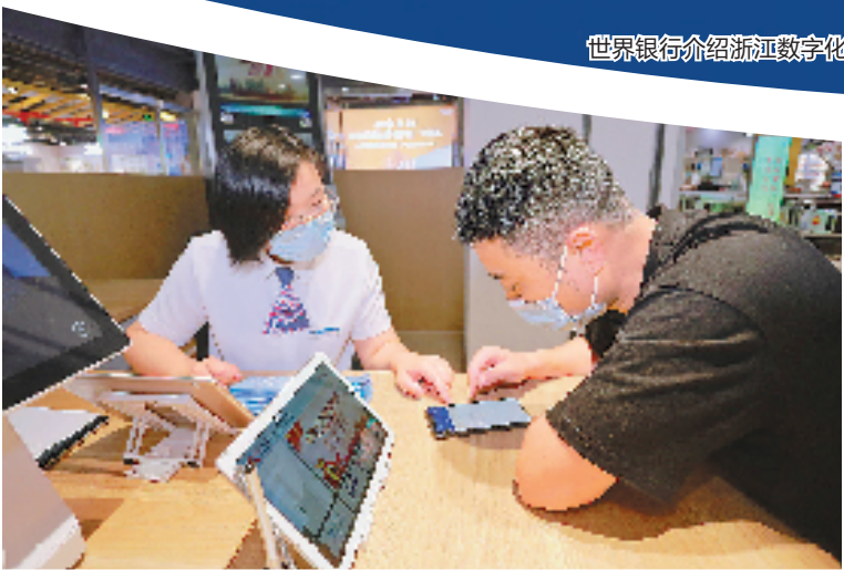
杭州市临安区行政服务中心工作人员宣传“网上办”“掌上办”政策业务知识。