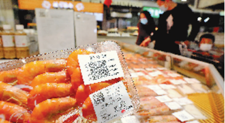
杭州市民在世纪联华超市选购进口冷链食品,用手机支付宝扫描包装上的“浙冷链”二维码即可了解商品,溯源进口全流程。