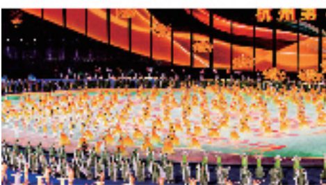
2023杭州亚运会（亚残运会）