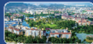
国内与国外 合作办学