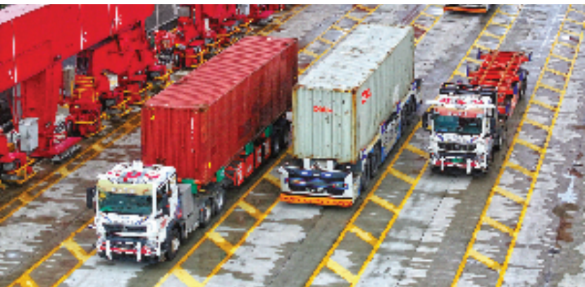
6月7日,在宁波舟山港金塘港区大浦口集装箱码头,无人集卡沿着规划路径自动驾驶。大浦口集装箱码头的数字化改造工程,是宁波舟山港“2+1”智能化码头示范工程之一。预计到2025年底,大浦口集装箱码头将全面实现高水平的自动化运营。

着力提升科技创新策源能力。发展新质生产力,创新策源能力是基础和关键支撑。当前人工智能等未来产业快速发展,我国仍面临许多“卡脖子”技术问题。长三角汇聚了国家许多“压箱底”的战略科技资源,拥有上海张江、合肥两个综合性国家科学中心,国家重点实验室数量在全国占比约20%。期待长三角通过更大力度地统筹科技创新力量,代表国家硬科技,在最核心的关键领域为中国在全球赢得一席之地。浙江要找准方向,利用好浙江大学、西湖大学、之江实验室等高能级科创平台,