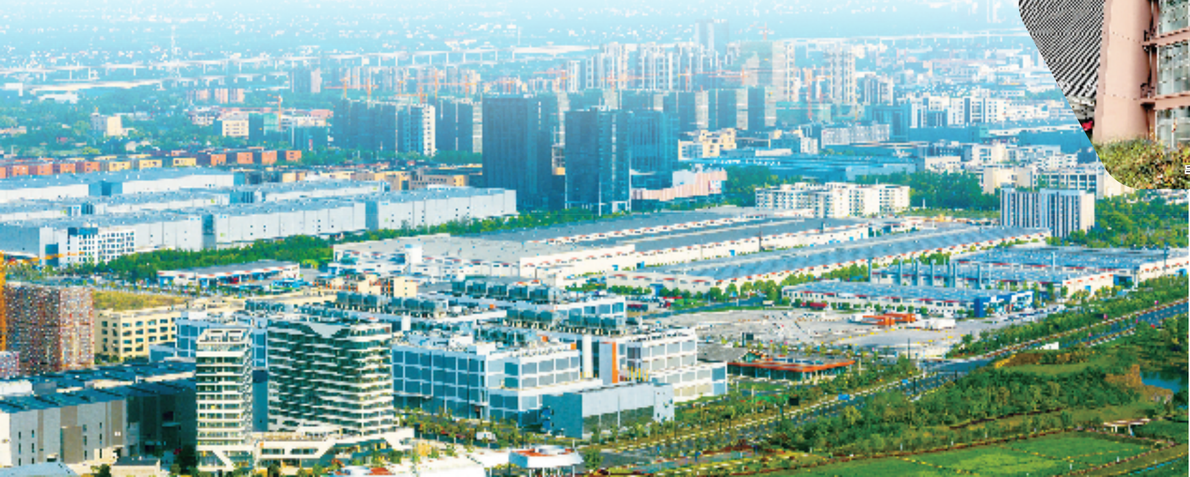
浙江余杭经济开发区

集聚更多层面、更广范围的人才,向高攀登、向新发力,余杭不断助推人才实现“飞驰人生”式的跃进,赋能产业实现“高原建峰”式的发展。