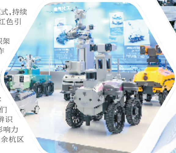
申昊科技巡检机器人

目前,余杭推动组织架构与治理架构、党建工作与生产经营深度融合,努力培育形成具有一定知名度的数字经济党建示范点,孵化形成具有较大影响力的数字经济党建示范集群。“我们希望打造出具有余杭辨识度、省市贡献度和全国影响力的数融党建工作品牌。”余杭区经信局相关负责人说。