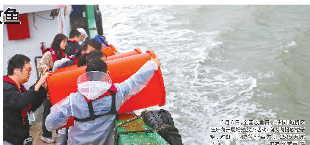
6月6日,全国放鱼日,台州市路桥区在东海开展增殖放流活动,向大海投放梭子蟹、对虾、乌贼等小苗共计2515万尾(只)。

省农业农村厅启动水生生物增殖放流苗种供应体系和社会定点放流(放生)平台建设工作。活动现场,杭州首个省级内陆天然水域放流平台在建德市梅城镇揭牌启用。市民可通过搜索