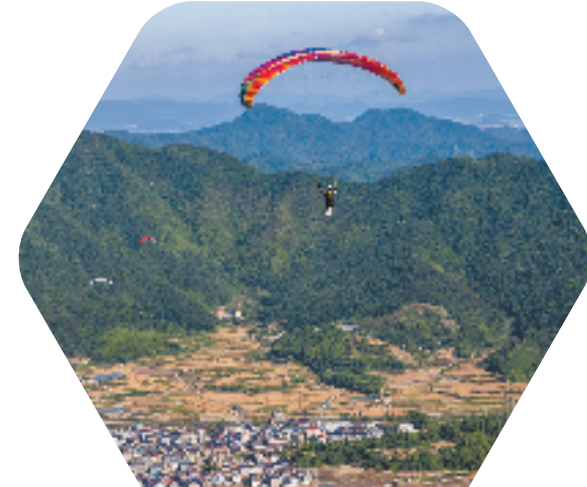
长三角滑翔伞定点降落邀请赛在宁海胡陈乡举行

在新时代的山乡巨变中，宁海以艺术带动美丽乡村“出圈”，用绿色描绘和谐画卷，共创美好生活，奔向共同富裕。