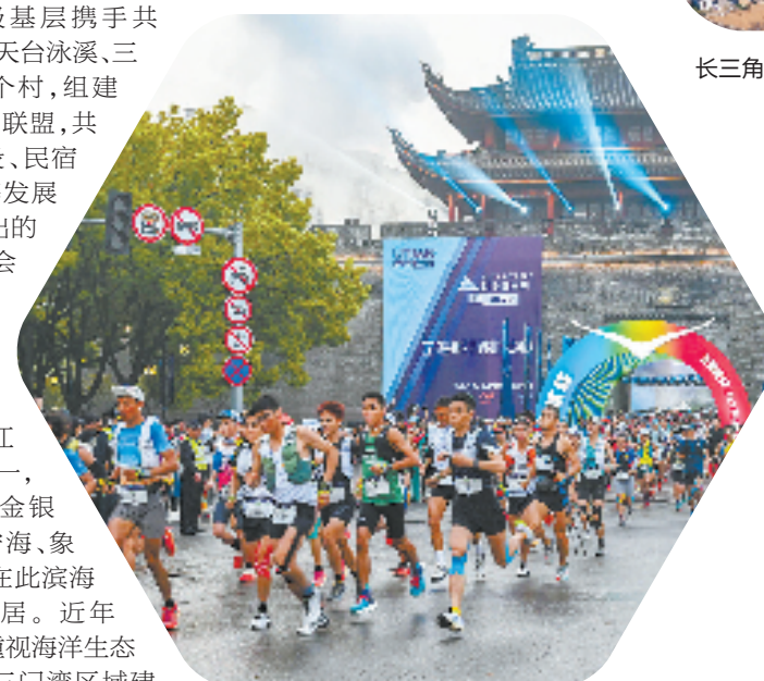
2023年宁海越野挑战赛