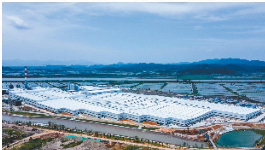
位于宁波南部滨海新区的旗滨光伏高透基材项目厂房

正处于吸引人才的好时机。今年初，借助“新春第一会”，面向各界人才广发“求贤若渴”的“英雄帖”——宁海热切期盼四方英才纷至沓来、争做科创蓝海的“弄潮儿”、科技高峰的“攀登者”。