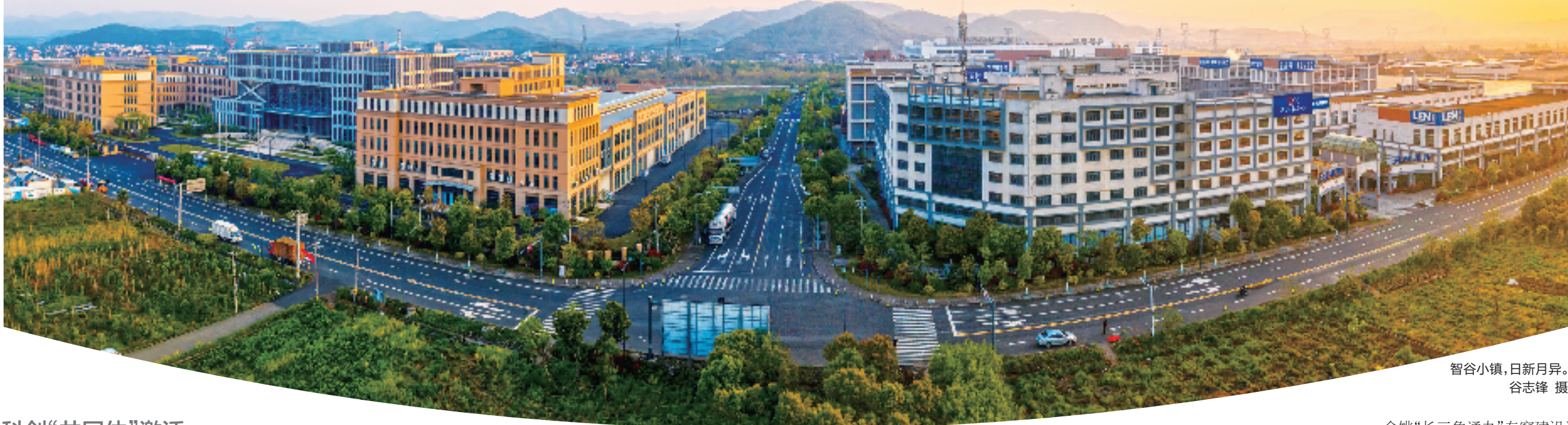
智谷小镇,日新月异。

从基础设施到公共服务,从产业集聚到创新协同,从深化改革到扩大开放——今天的余姚,正在接轨“长三角一体化”中谋划“更高质量”发展,激发“千帆一道带风轻”的势能,迈向“奋楫逐浪天地宽”的新格局。