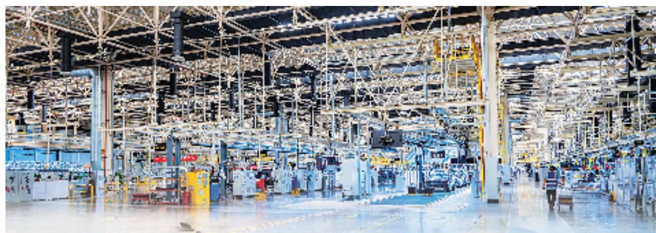
领克“超级工厂”

放眼余姚,这座“全国百强县”正全面融入长三角一体化发展,在更大的范围配置资源、布局产业,逐浪“大循环”,不断提升余姚在长三角价值链中的位置。