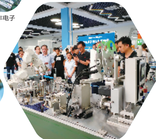
浙大机器人研究院

余姚“长三角通办”专窗建设运行,落实专人负责长三角地区“一网通办”办事系统应用,截至目前,长三角通办量达到1600余件,全市“一网通办”率99.92%，“一地创新、全省共享”典型案例被省级录用13条。余姚市153家定点医院、353家定点零售药店全部开通跨省直接结算服务,其中跨省住院费用直接结算率86.04%。余姚还推进放心消费长三角建设、长三角地区行政执法等体制机制的构建。