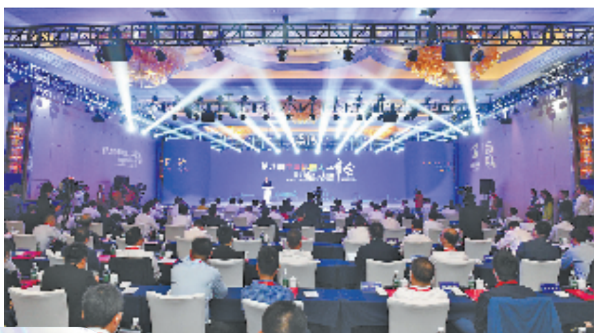
第八届中国机器人峰会活动现场