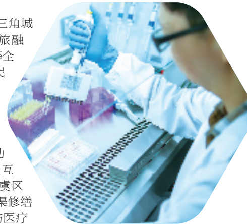
来凯制药落户余姚