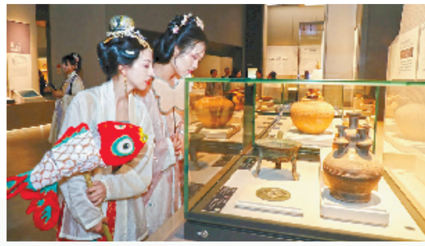
2024年“5·18国际博物馆日”浙江省主会场活动在绍兴上虞启动

不满足于历史,面向未来和肩负着新时代新文化使命,浙江正不断汇聚起奋力书写文化繁荣兴盛新篇章的强大合力。