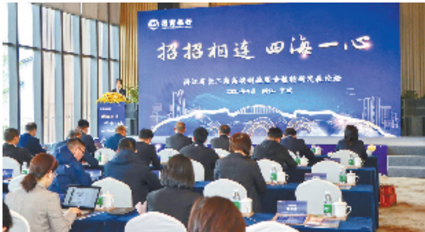
“招招相连·四海一心”浙江省长三角高端制造暨专精特新发展论坛现场。

工程”，金融活水正是助推“地瓜经济”蓬勃发展的关键之一。招行在监管部门的指导下，逐步完善产品服务体系，积极探索“脱核”模式，尤其是在供应链金融、金融科技产品上，实现“一站式”服务长三角甚至全国上下游企业。