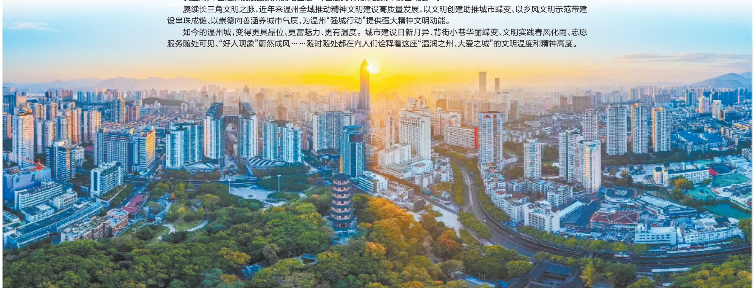
“温润之州、大爱之城”成为温州的独特气质

如今的温州城,变得更具品位、更富魅力、更有温度。城市建设日新月异、背街小巷华丽蝶变、文明实践春风化雨、志愿服务随处可见、“好人现象”蔚然成风……随时随地都在向人们诠释着这座“温润之州、大爱之城”的文明温度和精神高度。