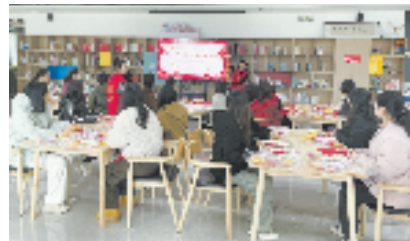
“我在新时代文明实践站过春节”赏年画做春联送祝福活动现场

今年起,温州以乡风文明示范带为突破口,深挖广大乡村蕴含的宋韵文化、耕读文化、海洋文化、侨乡文化等多元文化要素,将区域相近、民风相通、文化相融的文明村镇串珠成链、连点成面。按照“红、绿、蓝、金、古”五大色系主题,打造一批具有乡土气息、韵味风味的乡风文明示范带。