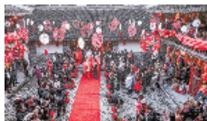
平阳县鸣山村新时代文明实践婚礼基地正举办中式婚礼

如平阳凤卧镇各村整合省一大会址、“闽浙边临时省军区司令部”旧址等资源,打造“红色”主题乡风文明示范带;洞头围绕海上花园、最美海岛,推出“文明旅游+诚信经营”示范带的蓝色主题乡风文明示范带。还有一盘菜(瓯菜)、一条鱼(大黄鱼)、一根草(铁皮石斛)、一杯奶(一鸣奶)、一个果(瓯柑、杨梅等)、一片叶(温州早茶)等“六个一”特色金色产业致富示范带等。