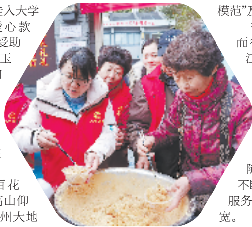
文明实践活动成为温州城市风景

截至去年12月,温州已培育县级以上各类道德典型16188人,其中“全国道德模范”及提名奖10人,“浙江省道德