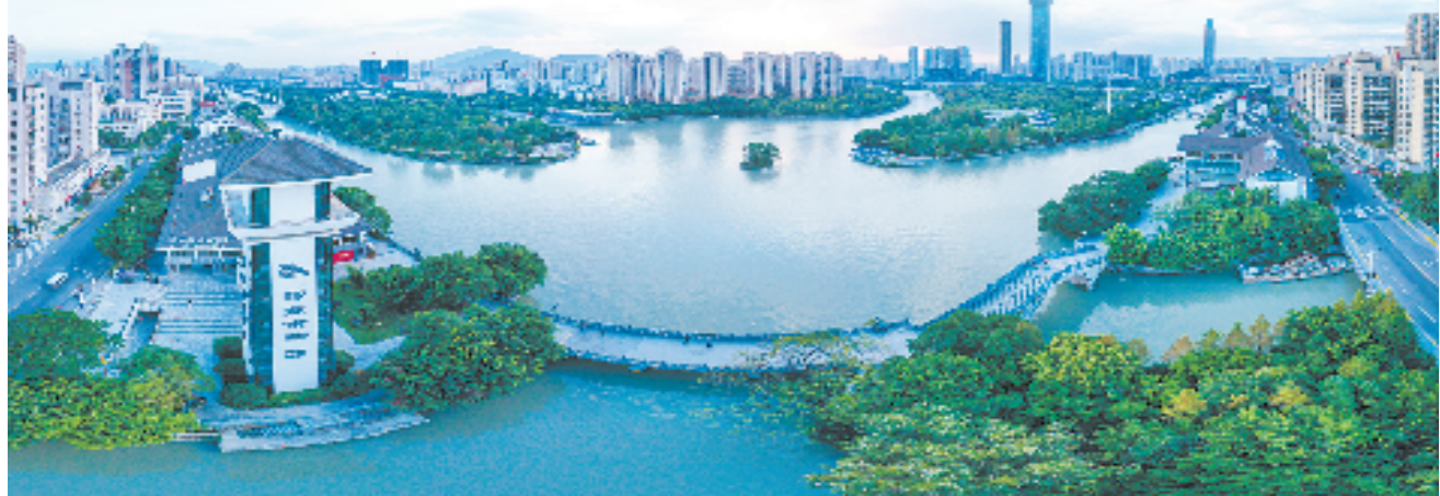
温州通过文明创建助推城市蝶变

点滴细节之间,文明新风在温州见微知著,“润物细无声”地提升着这座城市文明的气质。