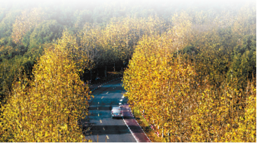
临平区“四好农村路”超山环线