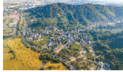
漕雅线径山花海段

农村公路建设通村畅乡,实现了开门见路、出门上车、开窗即景、家门口就业。据了解,2023年漕雅线周边区域接待游客600余万人次,旅游收入超5亿元。解决货源、品控、物流等多重困难,径山茶、鸬鸟蜜梨等特色产品远销海内外,径山茶品牌价值达31.65亿元,蜜梨产值2.4亿元,沿线各村镇人均可支配收入达到5.5万元,真正实现了百姓因路而富、产业因路而兴。