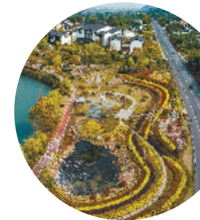
漕雅线茗溪湾公园段