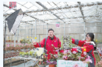
湖州市现代农业技术学校的学生在进行直播训练。

随着当地经济结构的调整,特别是埭溪镇美妆产业的快速发展,湖州农校及时转变学校发展定位,服务区域产业发展。早在2018年,该校与埭溪镇以及行业企业等多方共建湖州美妆学院,开启了学校建设和发展的新征程。这几年,从开设“美妆小镇”美容师培训班、打造美妆特色产业项目,到建设香料植物扩繁中心实训室、开