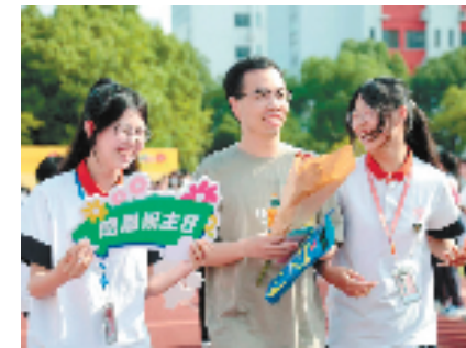
5月20日上午,湖州艺术与设计学校举办首届班主任节开幕式。

如今,湖州艺术与设计学校的“和美”育人体系正激励学生和同伴成长、和悦成人、和美成才。未来,该校将继续依托校园“和文化”,以艺术类教育为特色,立德树人,培养“艺美”新人才。