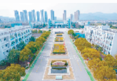
校园美景

接下来,学校将始终以高水平的办学治校能力和高质量的技术人才培养水平,为培育新质生产力提供坚实的职业教育支撑,为区域经济社会发展贡献力量。