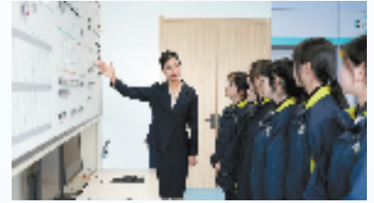
教师指导学生进行车控室IBP盘的实操操作。

接下来,湖州交通学校将继续深耕交通特色专业,不断擦亮校园文化品牌,凝心聚力培育更多新时代“工匠”人才。