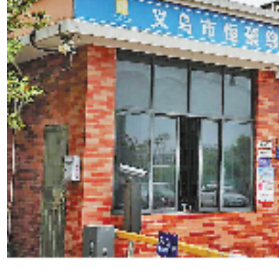
设置在企业门口的“勤廉意见箱”