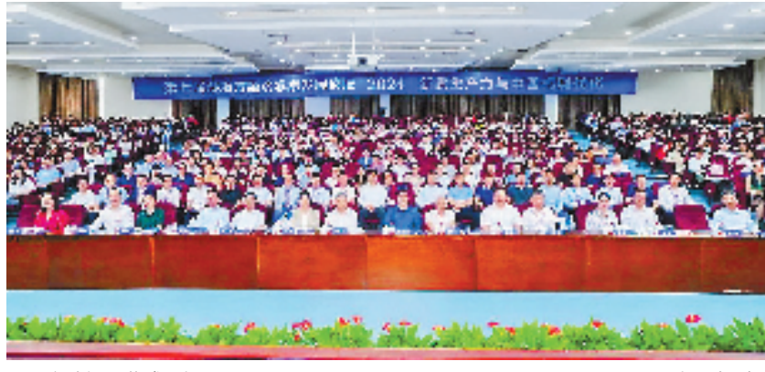
主论坛开幕式现场