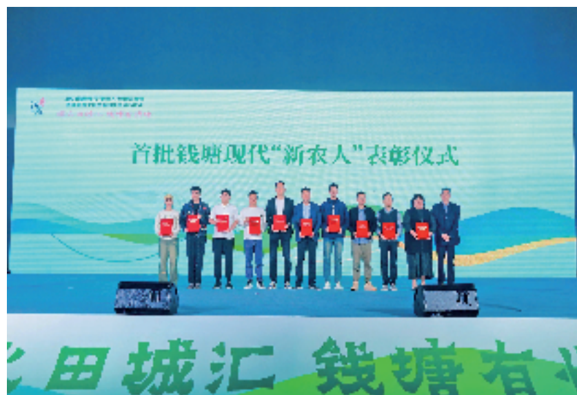
河庄街道选树首批钱塘现代“新农人”

总而言之,全面加强“三支队伍”建设,必须勇突破、闯新路,河庄正在破题,让“新农人”在广阔的乡野上奔腾。