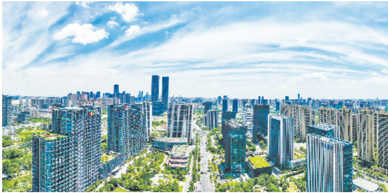
杭州高新区(滨江)物联网产业园

把目光拉回到全区层面,高新区(滨江)正在深入推进“标准一件事”集成服务改革。这“一件事”,为何被摆上重要位置?举个例子,对于企业来说,制定一项国家和行业标准,首先要找到相应的标准技术委员会,向其提出立项需求。然而,全国共有超过1500个标