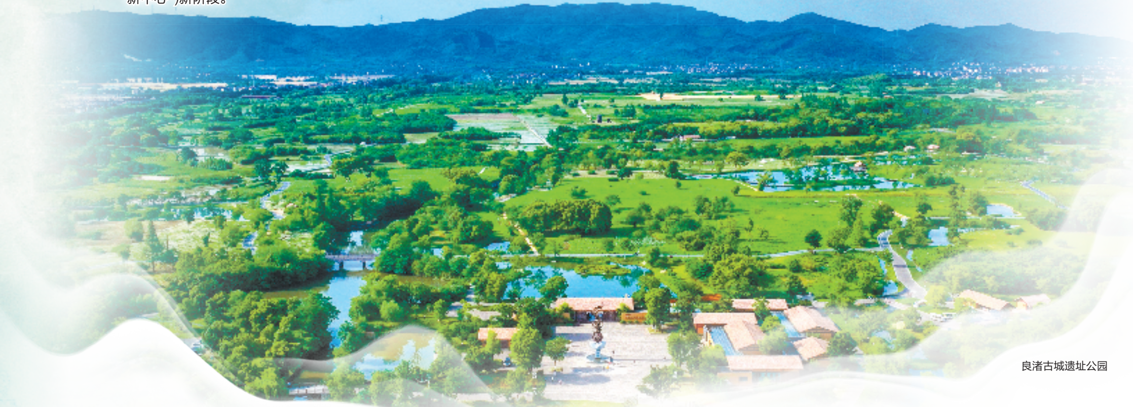
良渚古城遗址公园

三年裂变升级，如今“浙江经济第一区”正豪情满怀，坚定不移地推进文旅融合深度发展，丰富产品供给，繁荣文旅产业，壮大文旅消费，全方位打响“五千年中国看良渚”金名片，让文化艺术在这里成为一种生活方式，为持续擦亮“人间天堂·最忆杭州”金字招牌，为助力杭州建设世界一流的旅游目的地贡献余杭文旅力量。