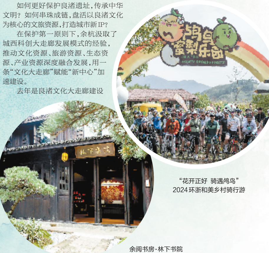
“花开正好 骑遇鸟鸣” 2024环浙和美乡村骑行游