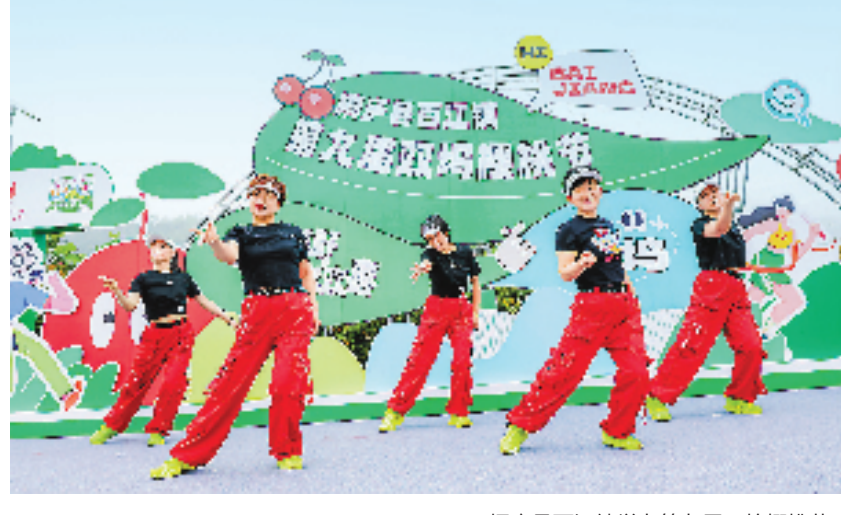
桐庐县百江镇举办第九届双坞樱桃节。

倒流映碧丛,点露擎朱实。樱桃成熟季节,在杭州市桐庐县百江镇双坞村樱桃基地,一颗颗饱满的樱桃挂上枝头,期待游客的到来。