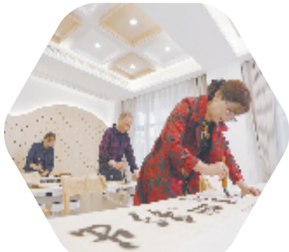
邻里中心内部活动空间

旧改践行“众人的事情由众人商量”的民主协商理念,创新建立“提出议题—广开言路—民主协商—拟订方案—居民表决—形成决议”的六步圆桌议事法,对小区居民提出的20余项改造意见予以全部采纳。健全居民议事协商机制,不断强化小区居民的“主人翁”意识,变“要我改”为“我要改”,极大提高了旧改质效,降低了旧改阻力。