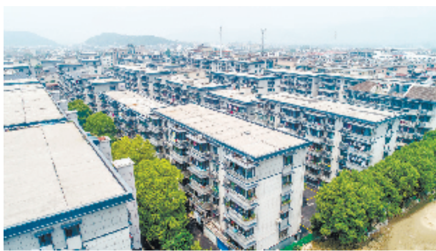
改造后的桃源小区