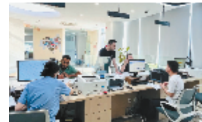
潮城英才之家为外籍人员办理审批事项现场

蝶变跃升，奋勇争先。响应新时代人才强国战略，在新征程中，海宁将全力和浙江大学共同建设杭州湾北翼科创枢纽，提升海宁创新资源集聚力、科技创新辐射带动力，打造人才生态最优市。