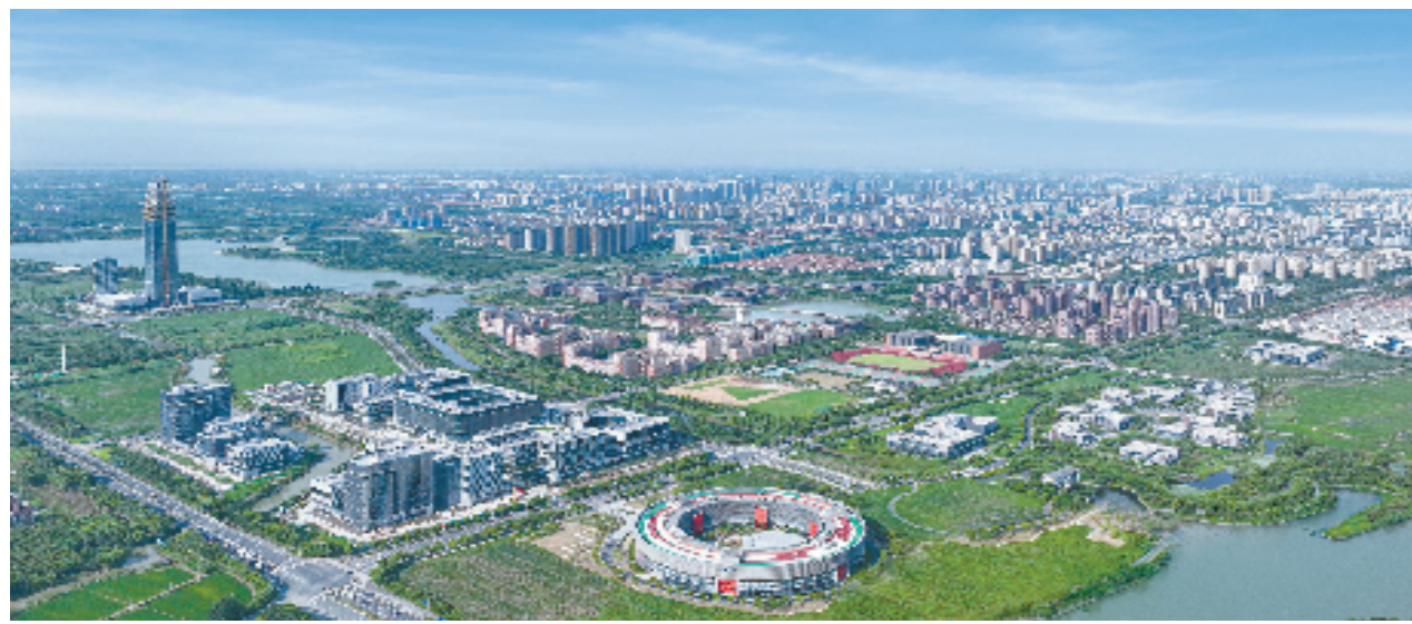
鹏湖国际科技城全景图