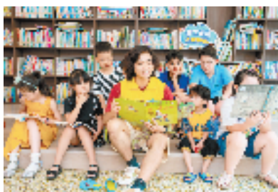
义乌市鸡鸣山社区开设“四点半课堂”

与此同时,江东街道全面加强党群服务中心建设,构筑强基共富主阵地,兼顾“带货”与“推广”双重功能,积极链接公益组织、辖区企业等多方资源,融入平安建设、垃圾分类、反诈宣