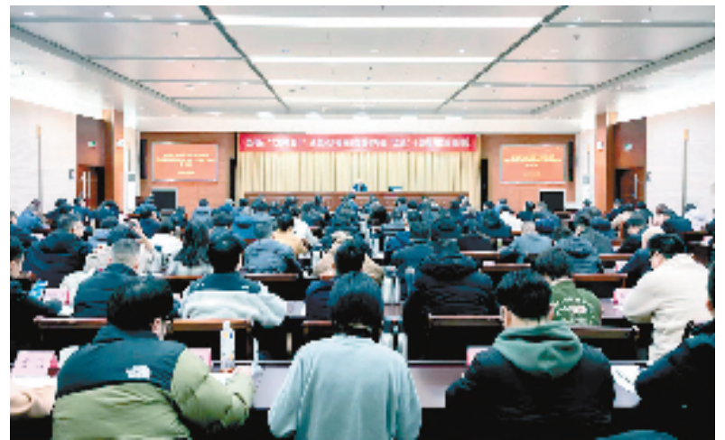
吴兴区“大抓项目年”商务经济高质量发展暨项目“双进”干部能力提升集训班

一切围绕项目转,一切盯着项目干。“大抓项目”贯穿吴兴区全年发展规划,“八大攻坚战”全力出击,狠抓项目建设和企业发展。今年,吴兴这座新青年城市,将以龙腾虎跃的工作干劲,努力实现争先进位。