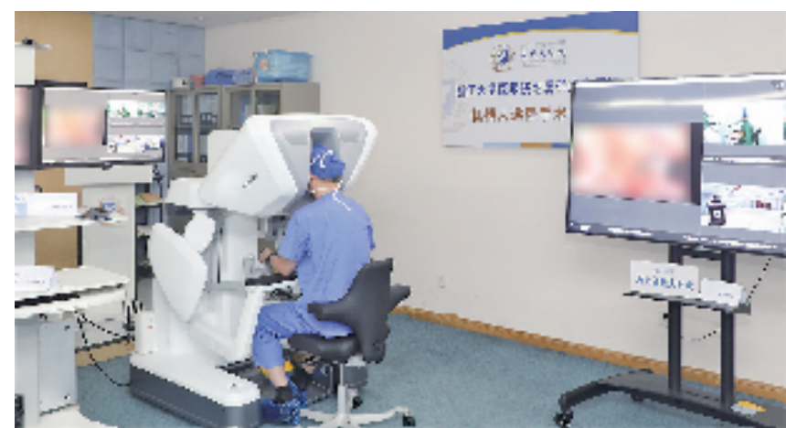
5G超远程机器人手术