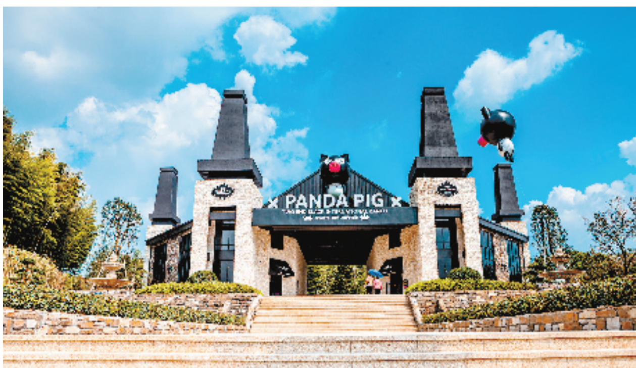
熊猫猪猪·两头乌国际牧场