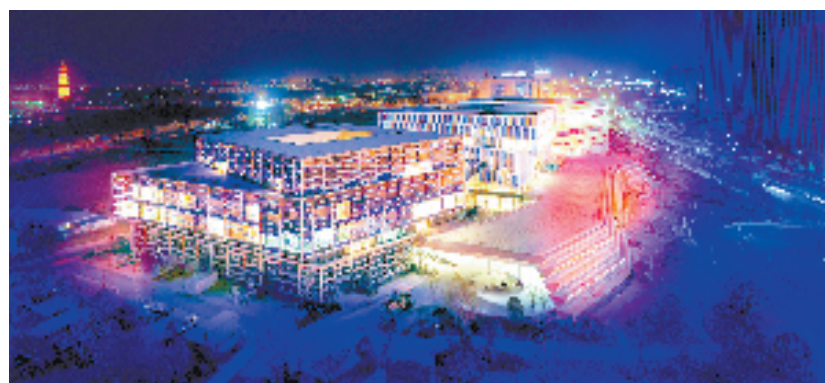
金华之光文化广场

“五一”假期,横店影视城将举办OST音乐节。OST是Original Sound Track的缩写,指电影或电视剧的影视原声音乐。音乐节以“影视剧原声音乐”为切入点,用耳熟能详的经典影视原声,唤起观众共同的时代记忆。横店影视城从2023年开始举