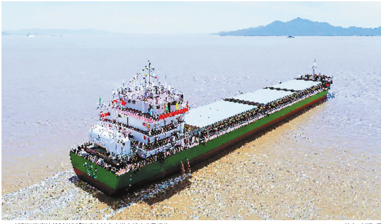
新型江海直达船“创新5”驶离宁波舟山港老塘山5号码头。

“随着舟山至重庆江海直达航线首航,舟山大宗散货能更快捷抵达川渝地区,川渝地区出海货物也将更快地被送