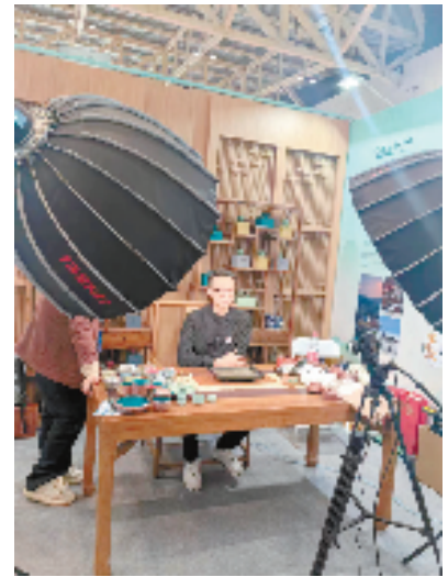
省文投集团在展会现场直播带货

该负责人认为,历史经典产业要焕发新机,就要适应当下数字营销新模式。省文投集团旗下长三角数字资产一体化交易平台和工美数字化营销矩阵,通过线上线下一同发力,扩展销售渠道,加强产业推广、助力品牌宣传,并协助各品牌企业完善设计、雕工等领域的版权保护。浙江历史经典产业走的是一条取精华、谋创新的路径,新内涵、新元素、新模式、新发展,为这些产业注入了流传的新动力,也寄望于它们再度熠熠生辉。