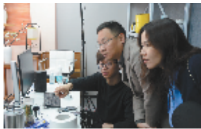
余杭区市场监管局开展直播企业合规指导

过去几年，随着大数据、云计算、AI技术的进一步应用，零售、消费平台的海量跃迁，平台经济迈入了提质升级的发展新阶段。一方面，平台经济规范化发展后对技术的研发要求更加精细；另一方面，算法技术应用不断促进效率提升，推动平台经济更加精准