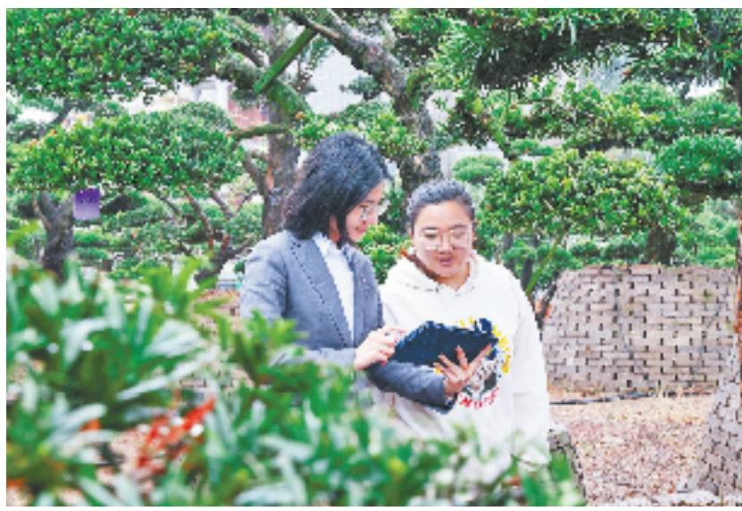
泰隆银行客户经理上门为苗木商户办理信贷业务

始终处于满负荷生产状态，产品供不应求。”该公司负责人说，“幸好有建行‘善新贷’的帮助，不然我们要减少进货量，还会损失不少订单。”