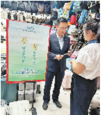
建行金华分行客户经理走访客户

近日，在浙江迪弗莱包装科技股份有限公司厂区，工人们正在各个生产线上有劳碌。“今年以来，我们