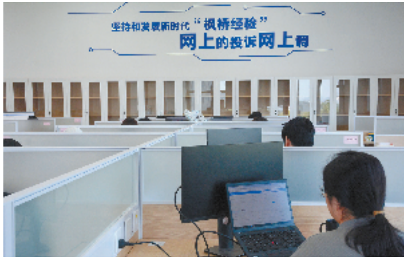
余杭区市场监管局“网购纠纷化解工作”入选2023年全省营商环境优化提升第三批“最佳实践案例”

力，为电商从业者提供一站式、全方位的教培服务，打造守规则、讲信誉、有本领的网店业主队伍。