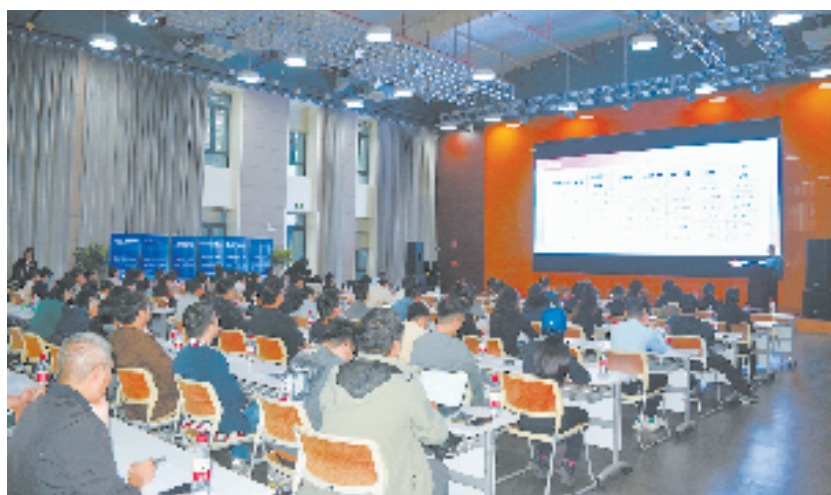
余杭区市场监管局开展平台企业员工素养提升培训

政府搭台，企业唱戏，余杭在系统搭建高素养平台经济劳动者队伍上不遗余力。在网店业主队伍培育上，余杭区市场监管局与淘天集团合作，联合发挥淘宝商家培训中心的作用，培养和提升电商人才的运营和合规能