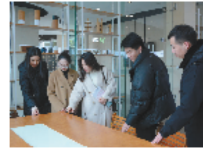
余杭区市场监管局助力企业触网上行

2024年第一季度，余杭区共受理网络消费投诉举报20余万件，占全省的1/3以上，普通消费者调解满意率达95%以上。“网购纠纷化解工作”入选2023年全省营商环境优化提升第三批“最佳实践案例”，“推动平台经济创新发展走在前列”工作列入《浙江省民营经济32条落地细则》全省落地模板。