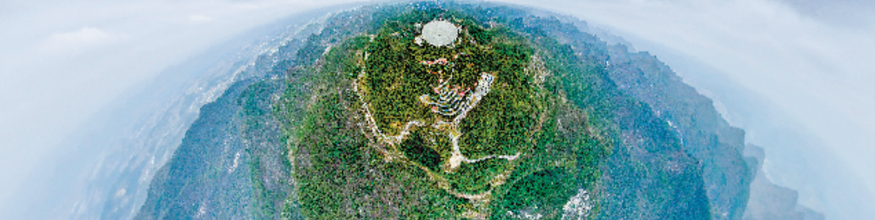
2月27日拍摄的“中国天眼”(无人机全景图片,维护保养期间拍摄)。