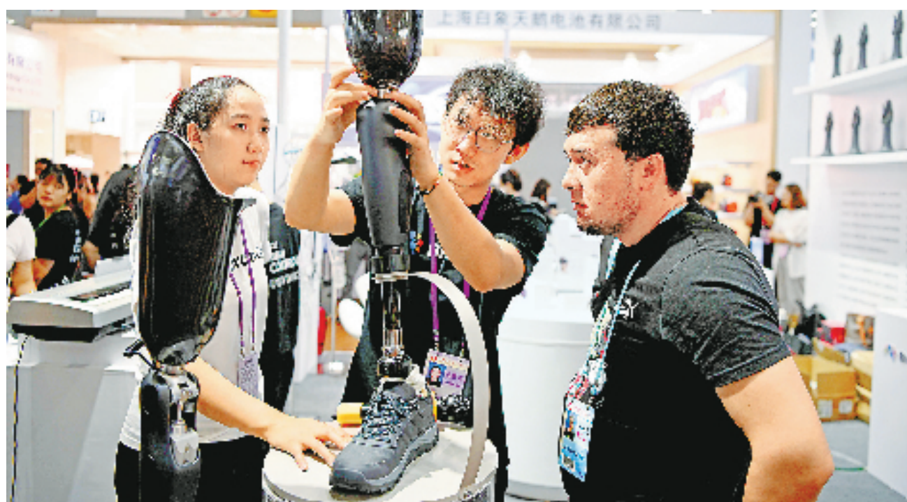
4月17日,外国采购商在广交会强脑科技展台观看智能仿生鞋。

此外,刘苏社介绍已完成地方政府专项债券项目初步筛选。他说,按照专项债券工作职责分工,国家发展改革委对地方报来项目的投向领域、前期工作等进行把关,完成了今年专项债券项目的初步筛选工作,目前已推送给财政部并反馈给各地方,财政部正在对项目融