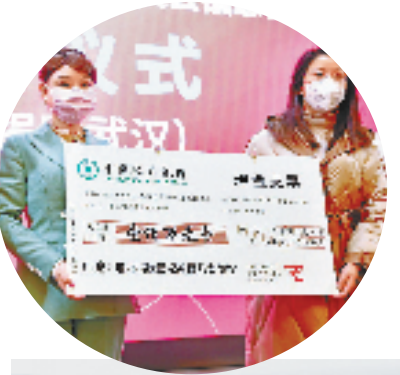
捐款支援疫情防控

2023年是了凡先生诞辰490周年，她又特别捐赠了35万元专项资金用于支持了凡书院的提升改造，并赞助了了凡高峰论坛纪念大会，让更多的人了解了了凡大师的善言、善举、善论，更好地滋养嘉善的向善土壤。