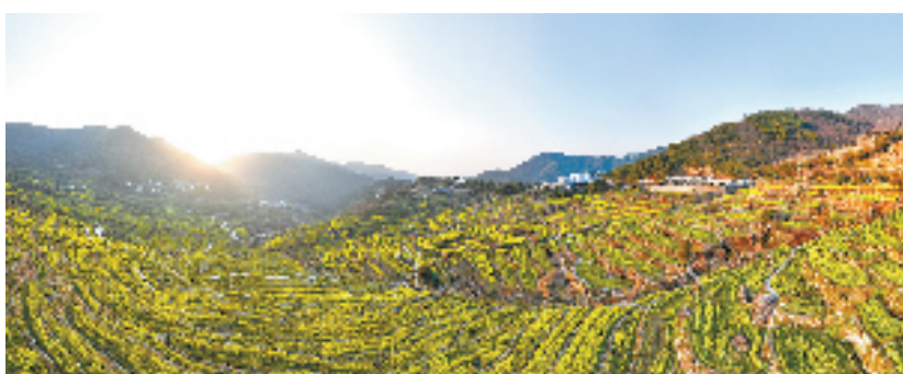
上虞区岭南乡东澄村覆后山下的油菜花梯田

发展不仅对内，更要对外。除基金助力法，山海协作法也是备受大家欢迎的“十法”之一。打破地域限制、格局制约、要素壁垒，开展区内“山海协作”党建联建，促进山区乡村与平原乡村统筹协调发展。上虞区盖北镇位于上虞东北，是省级特色农业强镇、中国葡萄之乡，基础设施完备；上虞区长塘镇地处上虞西南，是距离城区最近的南部乡镇，风光秀丽。一北一南，一海一山，如何融合？上虞区盖北镇、长塘镇建立共富共享“山海协作”，两地进一步找准优势互补、合作共赢的契合