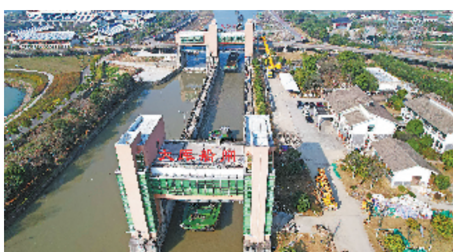
杭甬运河复航后,船只通过大船船闸。