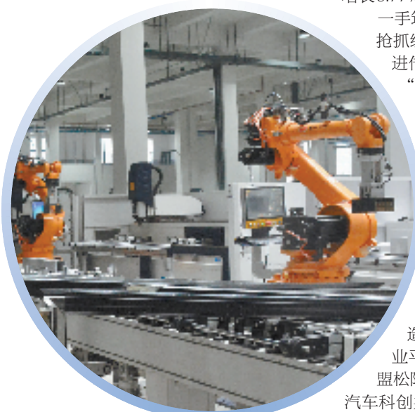
浙江华威门业有限公司生产车间