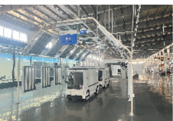
新石器无人车(松阳)有限责任公司

2023年，松阳新增省级以上重点人才科技平台7个，其中省级工程研究中心破零；新增全国技术能手2人，民营企业全职引进外籍博士1名，首次全职引进松阳籍博士人才1名，入选市绿谷精英人才15人，新培育高技能人才1805人，均实现历史性突破。