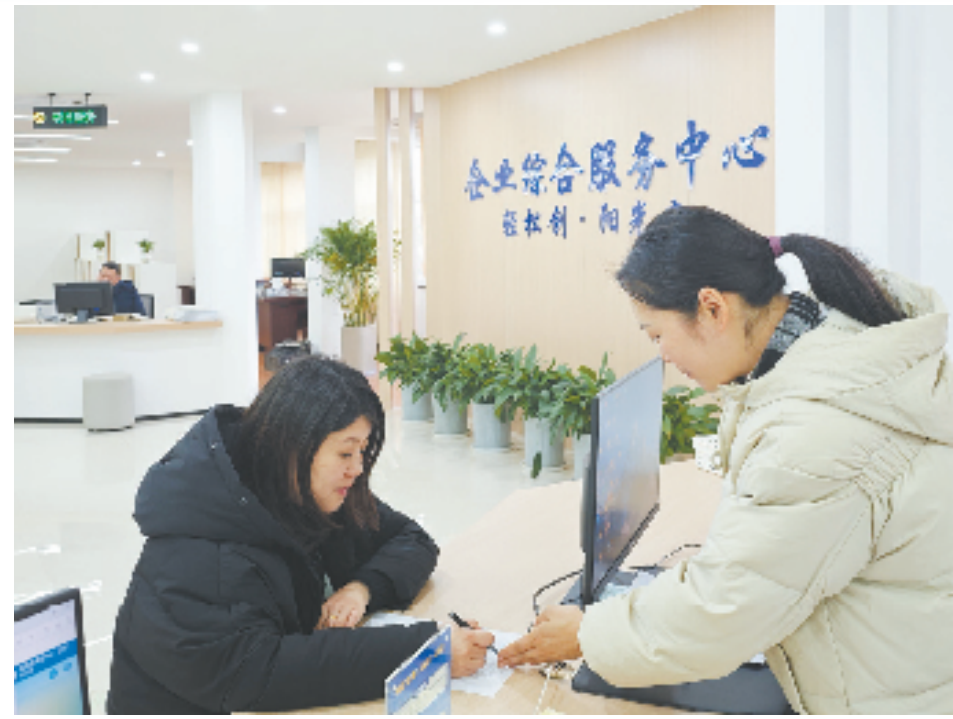
企业工作人员在松阳县企业综合服务中心办理业务

自松阳县第十一次党代会提出全面实施“二次创业”目标任务以来，松阳全县上下坚定不移推进新型工业化，在勇当先行者、谱写新篇章中推动“二次创业”行稳致远。