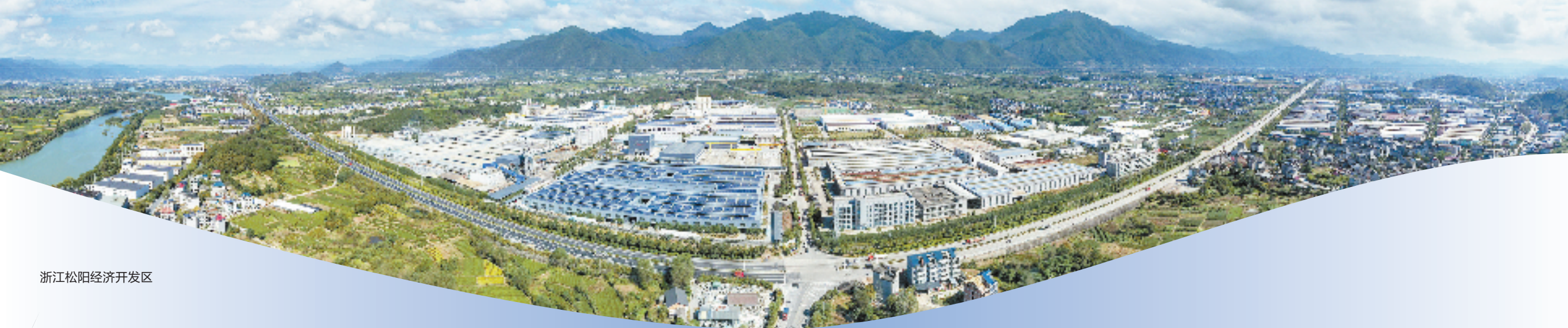
浙江松阳经济开发区

以生态工业的强势崛起推动“二次创业”行稳致远，松阳正锚定聚焦坚定不移推进新型工业化、坚定不移推进共同富裕的路径奋力奔跑。