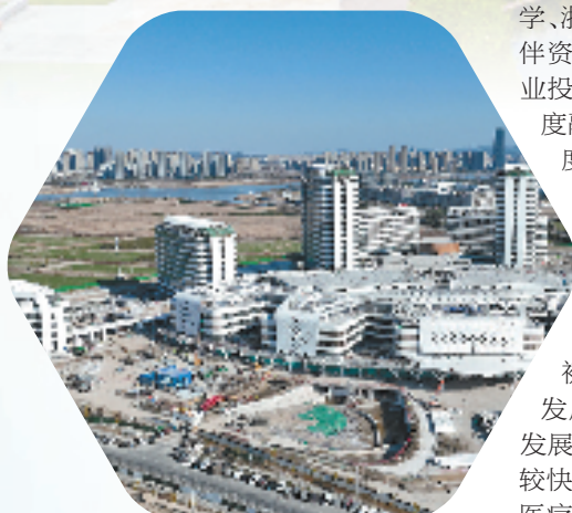
建设中的邵逸夫医院

学、浙江大学、邵逸夫医院等一流合作伙伴资源,形成“医疗资源+高校创新+企业投资+政府支持”的“政校医企”四方高度融合发展,加速推动精准医学产业深度创新及成果转化,打造“链接创新源头——重抓创新转化——推动产业集聚”的产业生态体系。”上虞未来城相关负责人表示。