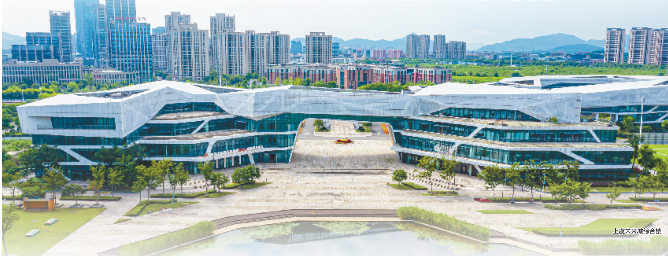
上虞未来城综合楼

作为“青春之城”的先行区、引领区、示范区,上虞未来城扛起“青春之城”首篇担当,正朝着举全区之力培育未来科技创新力量的城市蓝图蓄势起航;在2023年2月17日未来城开发建设办公室正式挂牌成立后的短短一年时间里,深化明确“一湾三谷两区”布局,高起点形成“1+3+X”规划体系,统筹推进21个总投资150亿元的项目建设,生命健康、数字经济齐头并进,产业发展实现“一年打基础”的工作目标。