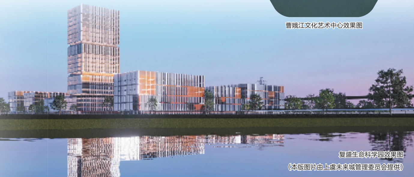
复盛生命科学园效果图