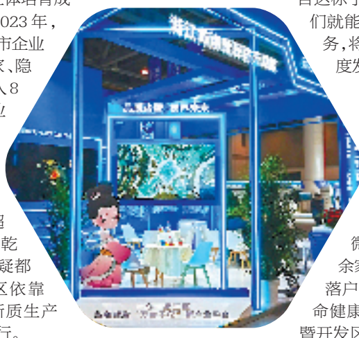
诸暨智能视觉产业平台发展展亮相第二届全球数贸会

新一年,诸暨开发区将奋力扛起创建“省高能级战略平台、国家级开发区”的使命担当,高起点推进国家级开发区创建工作,高标准建设智能视觉“万亩千亿”新产业平台2.0版,高质量招引一批有规模体量、有创新含量、有带动能量的链主型企业、标志性项目,以更大力度集聚创新资源、集中优质项目,集成配套功能,真正把开发区打造成为诸暨的新质生产力发展高地。