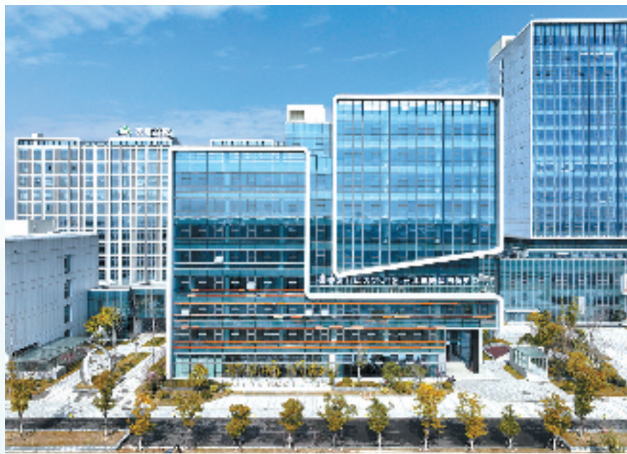
香港科技大学(广州)——诸暨联合创新中心