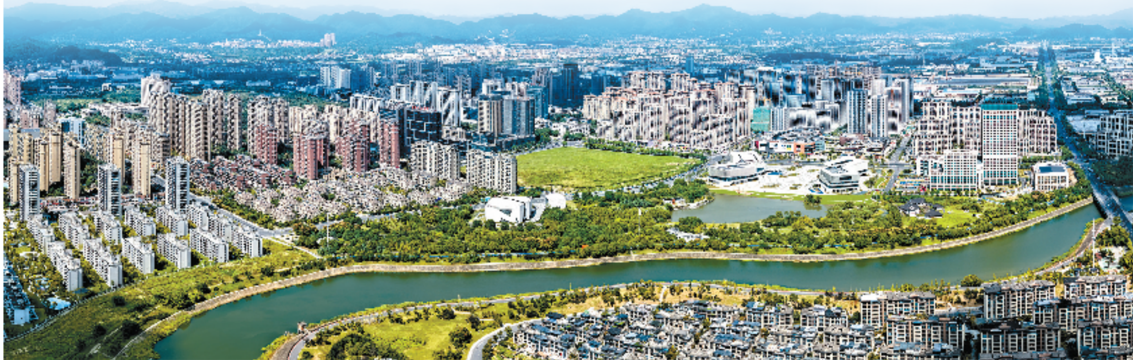
诸暨经济开发区商务区

奋楫者先,创新者强。新的一年,诸暨经济开发区将紧扣“智造之区·品质之城”的目标定位,以创建国家级开发区和建设“万亩千亿”新产业平台为主抓手,进一步树牢“制造业当家,企业家是英雄”“人才致胜,创新致胜”“坚持项目为王,外引内育两手齐抓”等理念,以好的理念、好的作风、好的机制来争创国家级开发区,努力打造新质生产力发展高地。