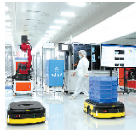
浙江辉辉光电科技有限公司生产车间

能视觉人才全球创业大赛,以赛助创、以赛促引、以赛聚才,筛选出一批科技含量高、市场潜力大、社会效益好的“金种子”项目落地诸暨。“我们会在赛事前摸排一些落地意向比较大的项目,提前进行对接洽谈,这样在落地后马上就能提供一系列的扶持和配套政策。”诸暨开发区相关负责人介绍。在2023年举办的智能视觉人才全球创业大赛上,诸暨开发区征集参赛项目200余个,促成包括睿熙科技等独角兽项目在內的8个获奖人才项目签约,还聘任包括两位院士在内的9位权威专家担任智能视觉产业发展顾问。今年,新一轮的智能视觉专项赛即将拉开帷幕,继续面向全球广发“英雄帖”。