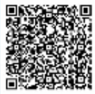
扫码观看智能视觉产业园的十二时辰