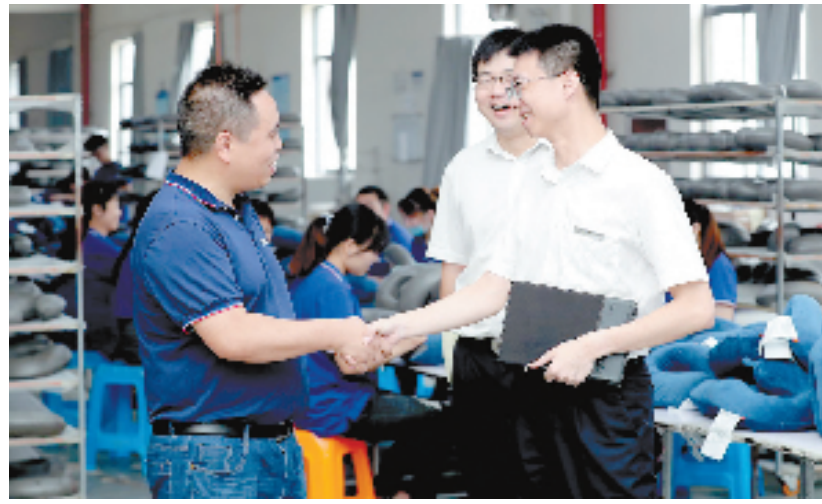
德清农商银行客户经理开展经营主体走访活动,让小微企业主享受便利金融服务。

贷款3637户,金额超200亿元;支持个体工商户贷款24934户,金额达136.91亿元。接下来,该行将继续探索建立全流程“智慧”风控模式,并通过系统管控对贷款进行全流程、信息化管理,实现系统自动监测与有效