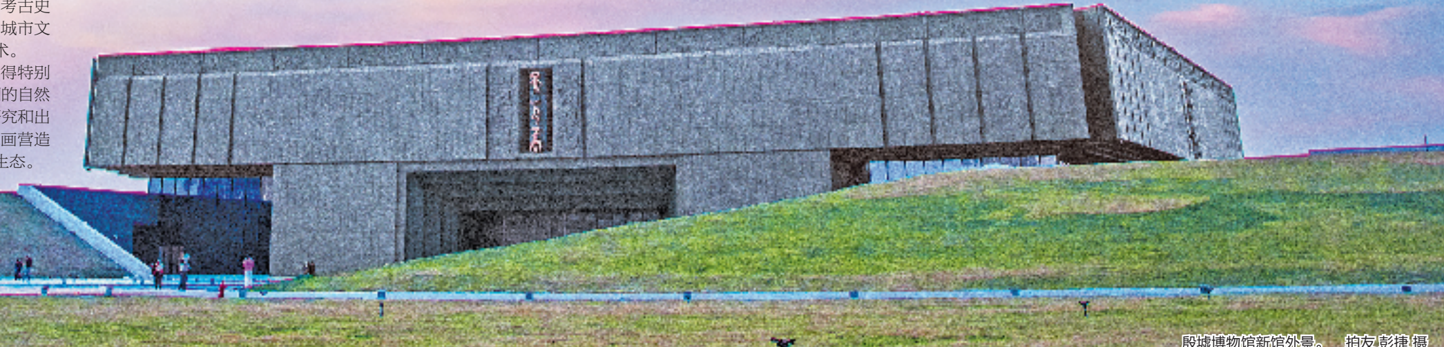
殷墟博物馆新馆外景。