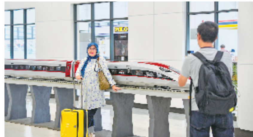
3月17日,在印度尼西亚雅加达,乘客在哈利姆站候车大厅和雅万高铁高速动车组模型合影。当日,印度尼西亚雅万高铁开通运营满5个月。雅万高铁持续为乘客提供便捷、快速的出行服务,成为当地人欢迎的交通工具。