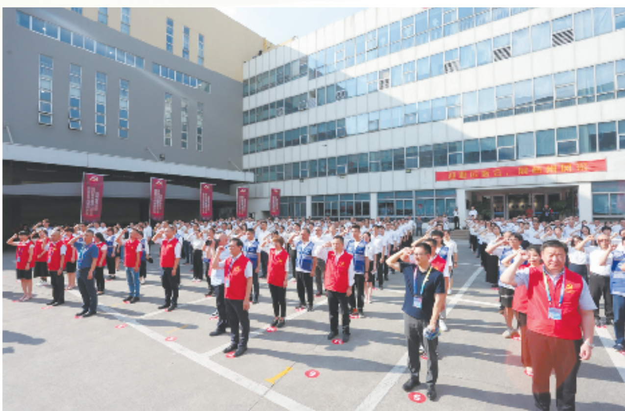
杭州联华华商集团亚运专仓攻坚临时党支部成立大会暨亚运保障誓师会