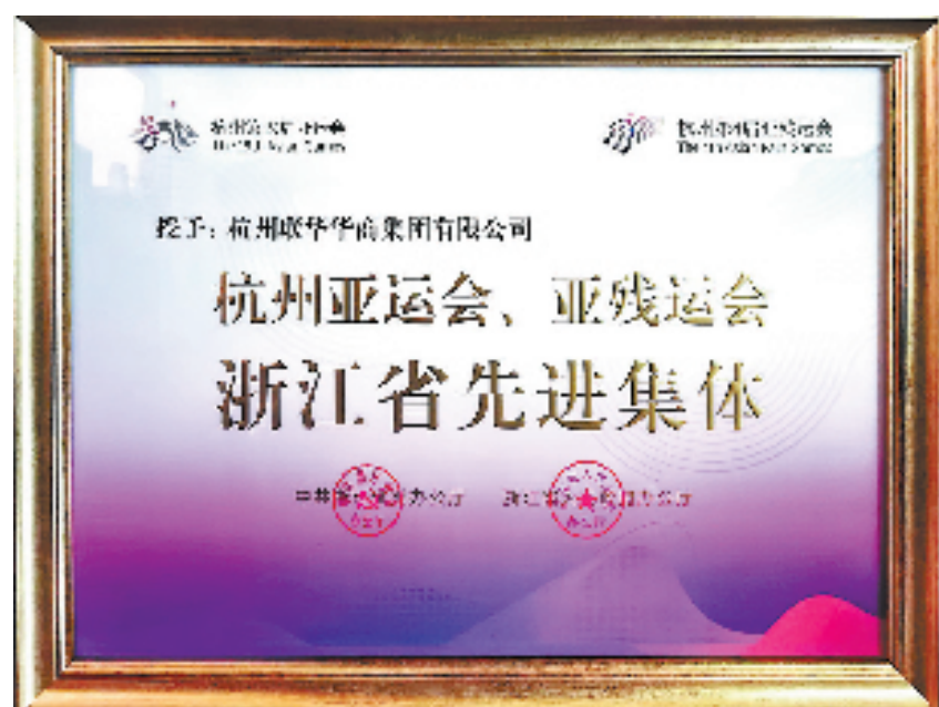
杭州联华华商集团被授予杭州亚运会、亚残运会浙江省先进集体荣誉称号

联华华商集团将持续“以消费赋能美好生活”为己任,让消费者敢消费、愿消费、乐享高品质消费,优化消费环境,增强人民群众的获得感、幸福感、安全感。