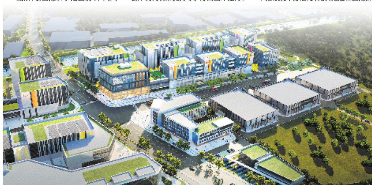
杭州临空经济示范区 GMP 标准厂房效果图

可以想见,全市之力聚焦下,杭州临空经济示范区的新一一年,会走出更广阔、更明亮的天地。