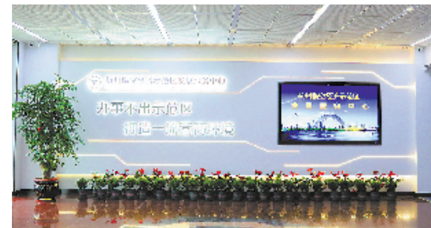
杭州临空经济示范区发展服务中心

今天的杭州临空经济示范区,能级之前所未有。作为省市战略的交汇点,这里将打造最一流的产业高地、最一流的开放门户、最一流的营商环境,直指“世界级开放门户”。