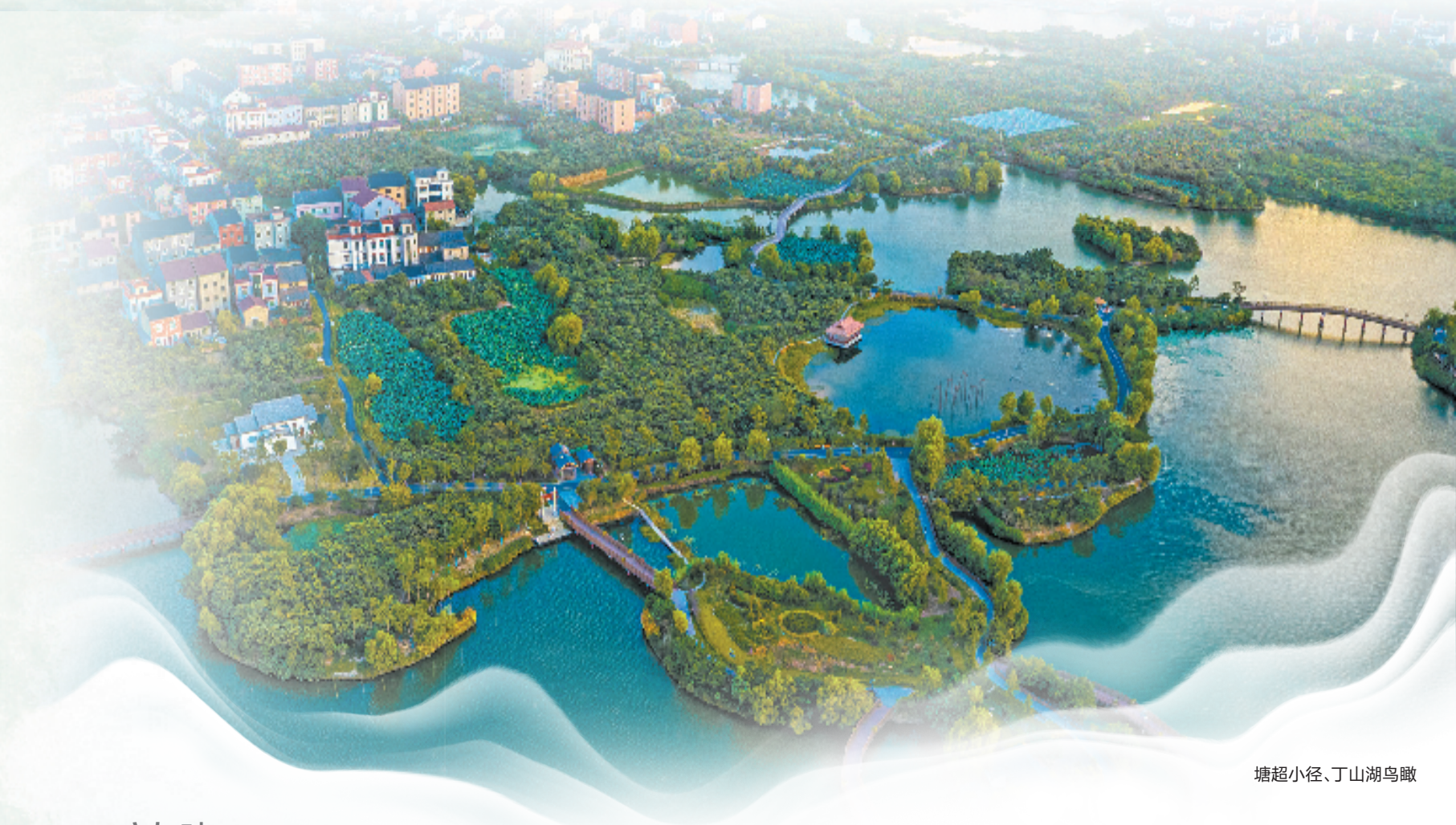
塘超小径、丁山湖鸟瞰

通过学术研究强化文化保护传承利用，通过项目建设将体验性强、可看性强、有市场需求的核心文化从资源转变为市民游客愿意买单的旅游体验，以科技赋能打开了年轻人了解江南水乡文化的新窗口。“学术研究+项目转化+科技赋能”的融合模式赢得旅游市场真金白银。在春节假期，临平景区（点）共接待游客近30万人次，丰富多彩的临平本土文化，吸引了来自全国各地的游客。