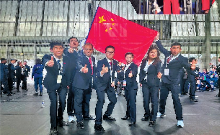
浙江代表团在法国参加第十届国际残疾人职业技能竞赛