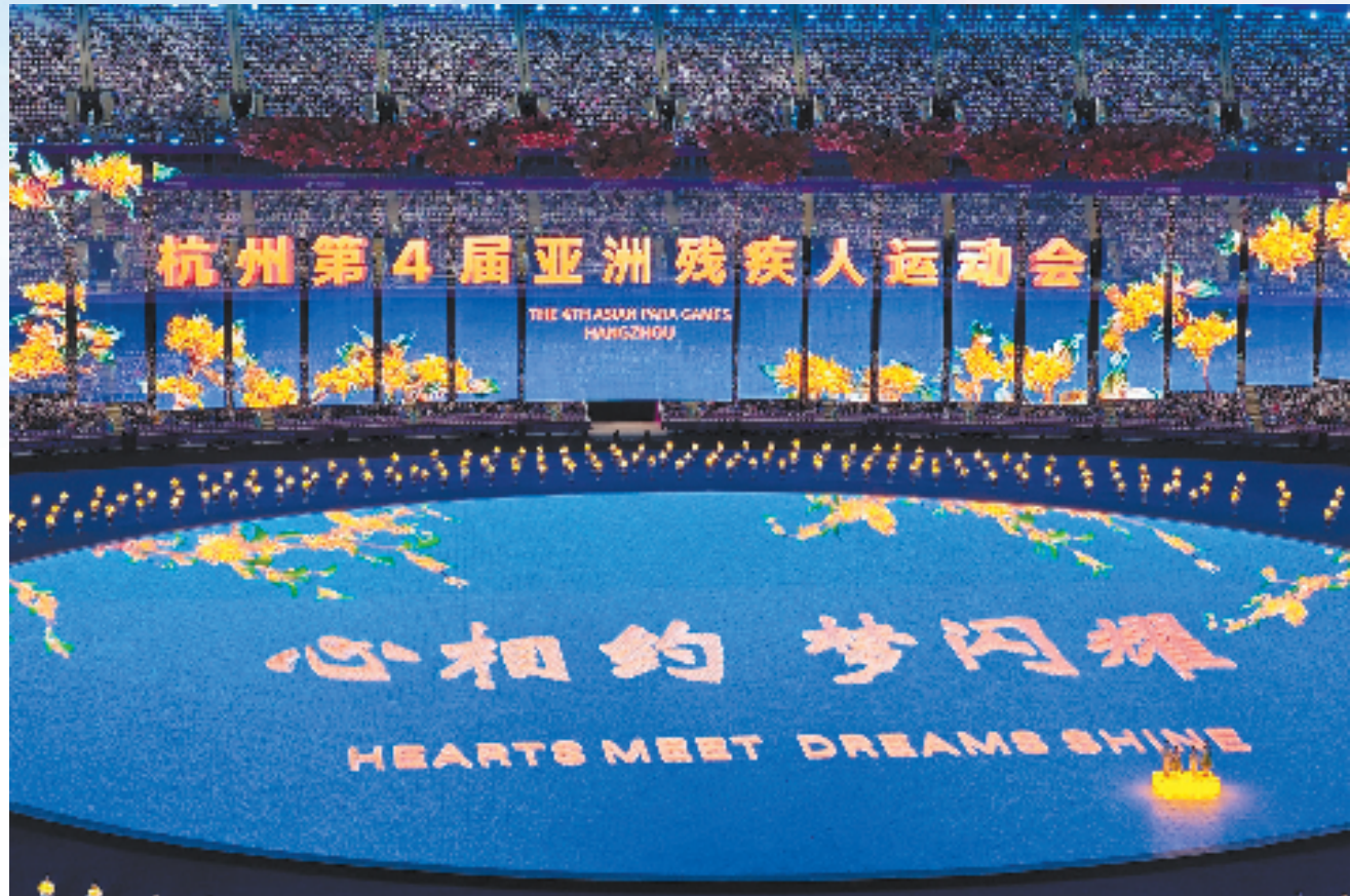
杭州第4届亚洲残疾人运动会开幕式

民生底线越兜越牢。省民政厅、省财政厅、省残联联合出台《关于加强残疾人两项补贴精准管理的实施