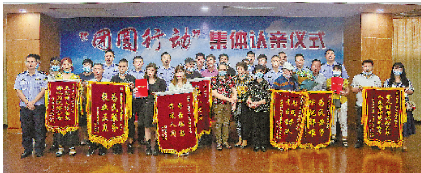
“团圆行动”集体认亲仪式上,台州公安收到一面面锦旗(资料照片)。