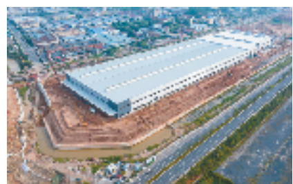
平台整治为企业腾出发展空间

人勤春来早,拼搏启新程。新春伊始,位于江山市南部的江贺经济走廊一派生机。大型机械轰鸣声此起彼伏,各项目工地上工程车有序进出,处处是催人奋进的“战鼓声”。这块以江贺公路为轴心、区域面积19.9平方公里的土地,历经多年积淀,工业企业林立,成为江山市经济发展的主要支撑点之一。