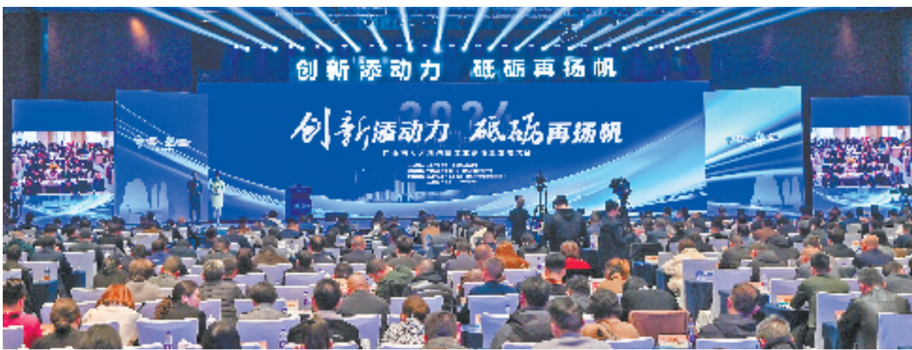
江山连续三年“新春第一会”聚焦工业强市建设

“全年GDP首次突破400亿元大关,增长6.8%;固定资产投资180.7亿元,增长21.5%……”2月20日,江山召开“新春第一会”——全市人才科创暨工业高质量发展大会,这也是当地连续第三年召开全市工业大会。