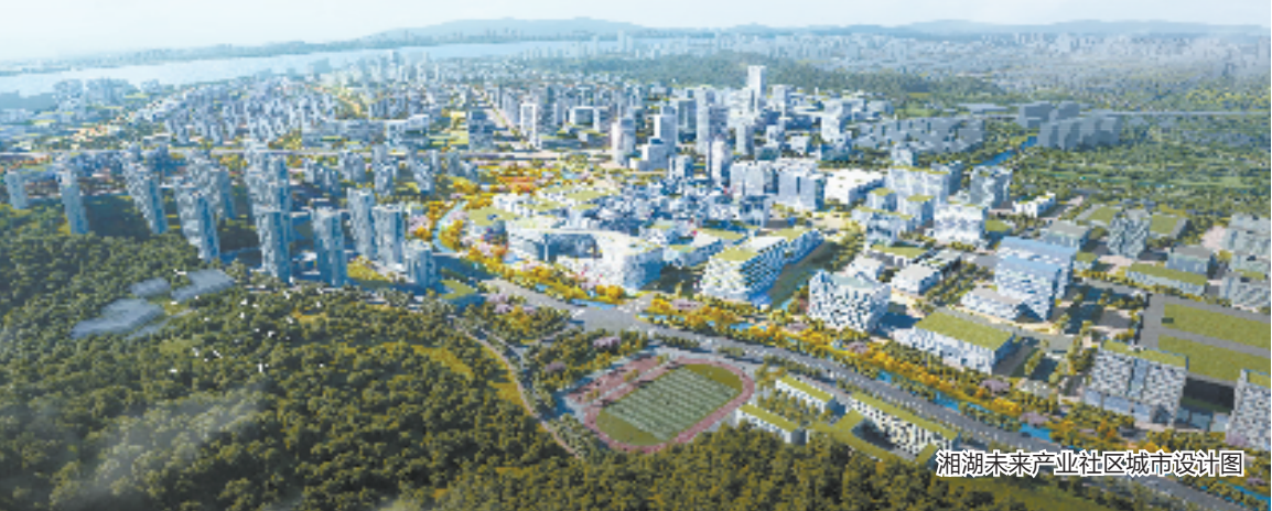
湘湖未来产业社区城市设计图