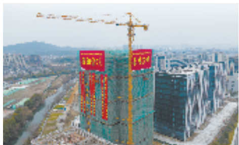
太能光电项目主体结顶