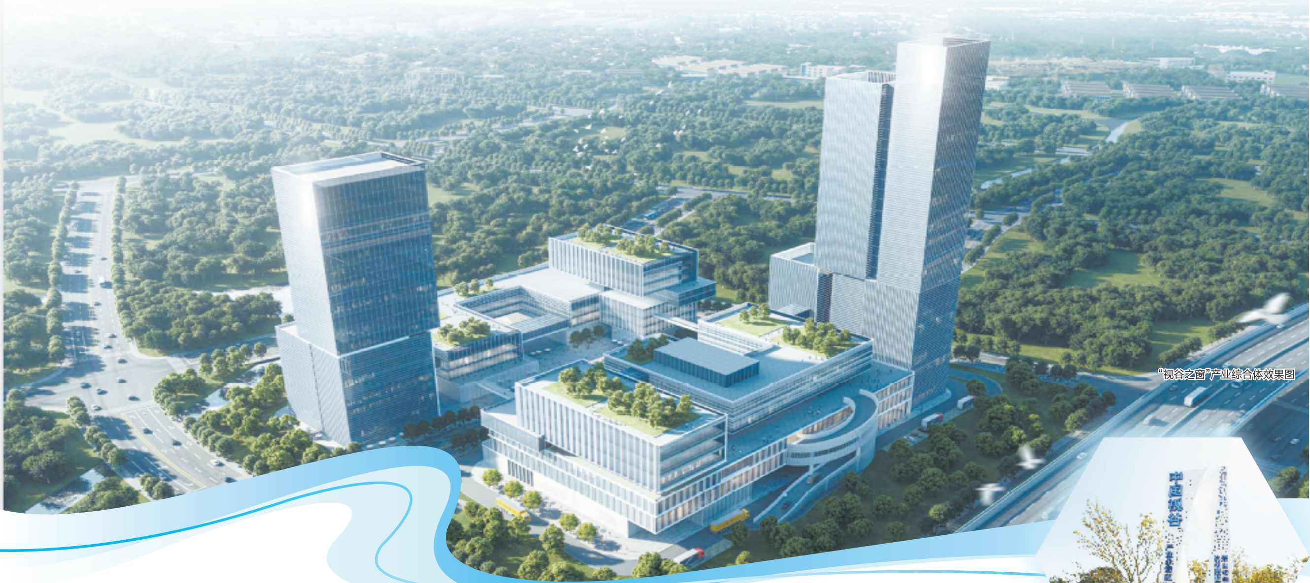
“视谷之窗”产业综合体效果图

新春第一会、新春第一歇……开春后的大动作，总被赋予风向标意义，它关乎起势，向外展示着一个区域抓经济、拼民生的头等大事。在省、市、区新春第一会后，萧山的新春第一歇，今年来到湘湖新城。今年2月22日，“视谷之窗”产业综合体在湘湖新城正式开建，总投资约20亿元，占地68亩，包括物联网产业园和增材制造产业园，将为中国视谷打造国家经济地理新地标提供空间载体支撑。作为省部共建的中国视谷的又一标志性成果，萧山的新春第一歇要撬动的，并不止于一个产业综合体。杭州以“中国视谷”为载体，正在打造智能物联赛道中的杭州旗帜，而依托湘湖新城，一个牵引万亿级智能物联产业生态圈的增长极已然成势、成型、成城。