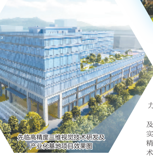
先临高精度三维视觉技术研发及产业化基地项目效果图

它是一座有着物理边界的新城。“经过两年的建设，湘湖新城中不仅多了中小学校、中国美院、湘湖越界等城市配套，道路、地铁等打通城市大动脉的基建也在加速建设中。”该负责人介绍，按照优化生产、生活、生态布局，将纵深推进湘湖系统提升，打造一张企业有感、近悦远来的城市样板图。