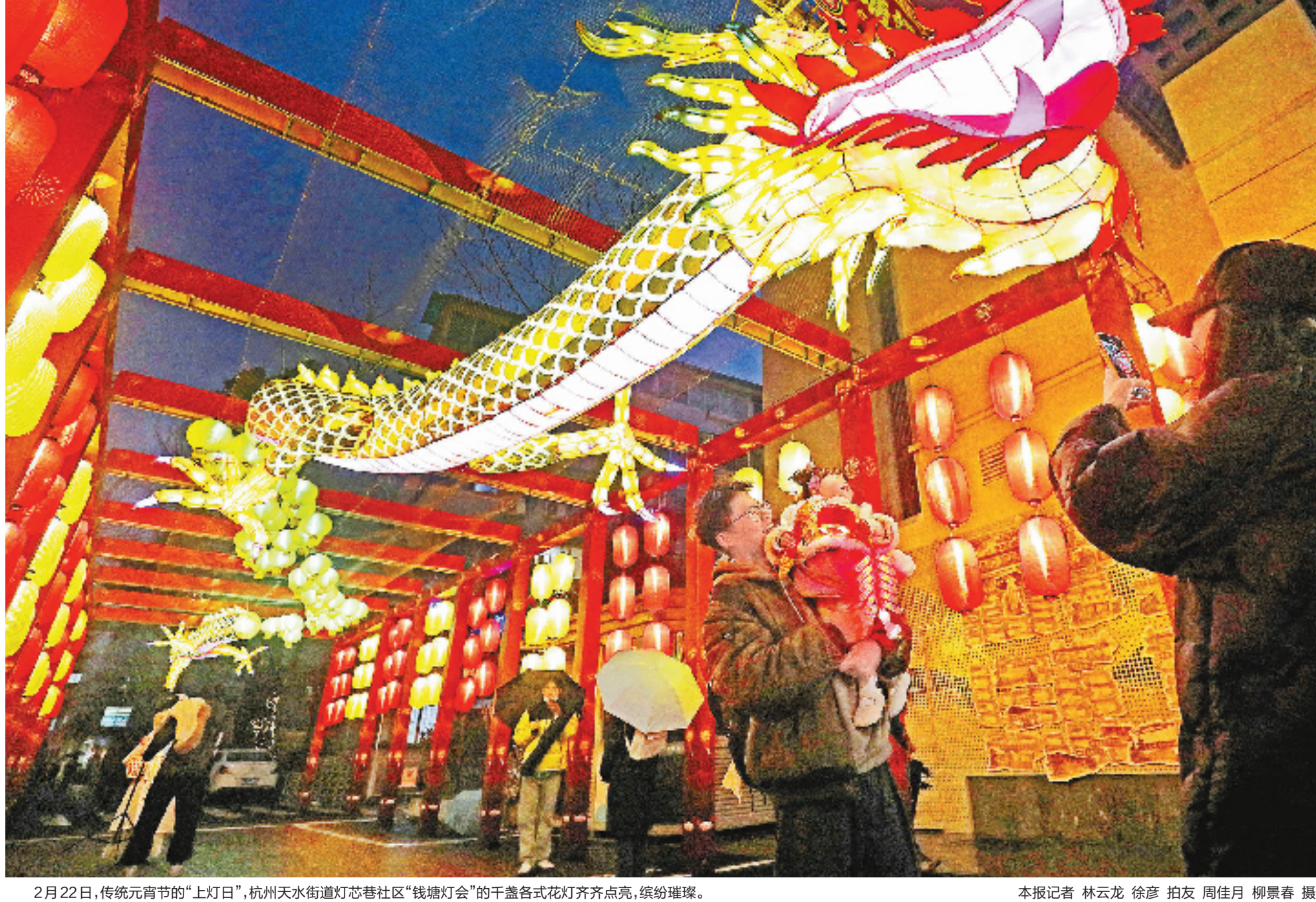
2月22日，传统元宵节的“上灯日”，杭州天水街道灯芯巷社区“钱塘灯会”的千盏各式花灯齐齐点亮，缤纷璀璨。