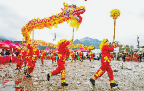
2月23日，杭州市临安区河桥镇老街热闹非凡，一支支特色非遗灯队举行踩街活动，喜迎元宵佳节。