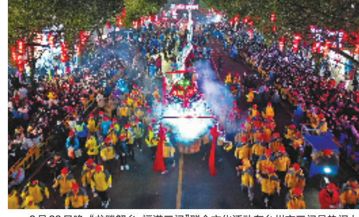
2月23日晚，“龙腾蟹乡·福满三门”群众文化活动在台州市三门县热闹上演，杨家板龙、高视牡丹龙等非遗项目上街巡游，吸引了众多群众观看。