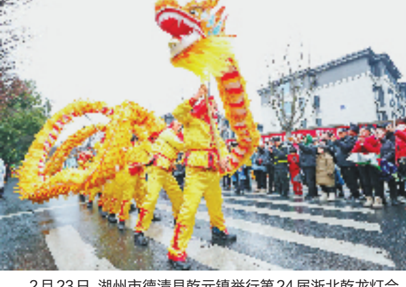
2月23日，湖州市德清县乾元镇举行第24届浙江乾龙灯会，12支舞龙队伍巡游在大街小巷，热热闹闹闹元宵。