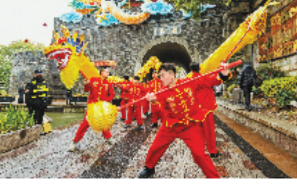
2月23日，一条金色的“祥龙”现身杭州市上城区清河坊历史街区，把元宵节的气氛拉得满满的。