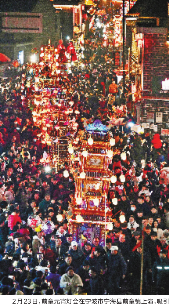
2月23日，前童元宵灯会在宁波市宁海县前童镇上演，吸引了众多市民游客慕名前来。

赏花灯、舞祥龙、猜灯谜……今天是元宵佳节，浙江各地多彩民俗近日轮番上演，不仅丰富了节日的文化内涵，也寄托着人们对美好生活的向往。