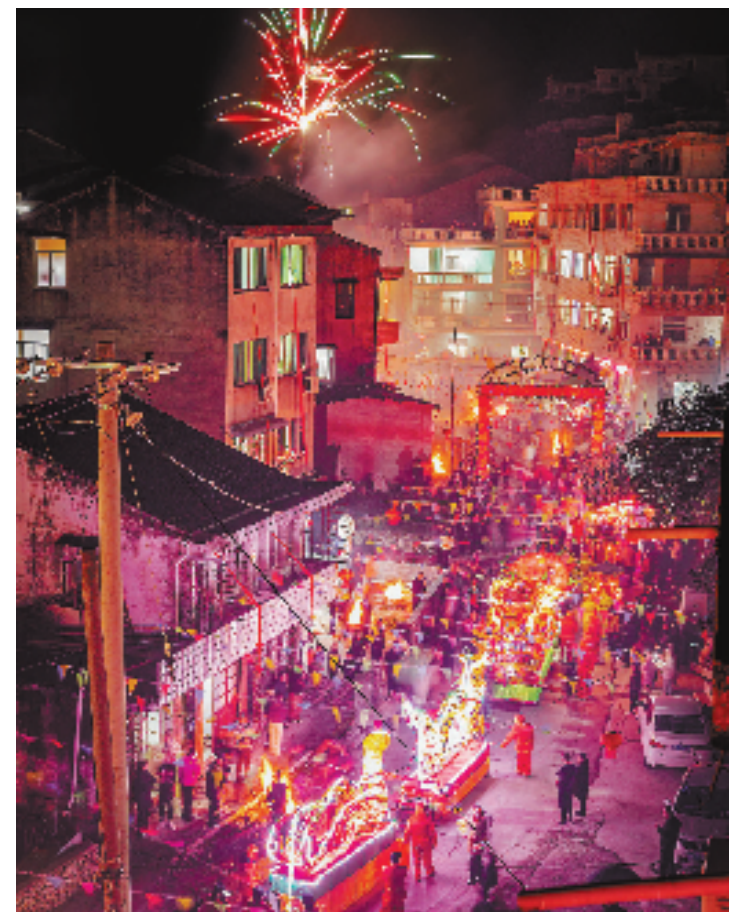
2月22日，温州市瓯海区泽雅镇周岙村村民自发组织“闹花灯”祈福迎元宵民俗活动，现场锣鼓喧天，热闹非凡。