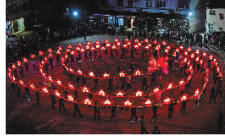
在金华浦江，夜色中的板凳龙热闹壮观，寄托着人们对新年美好生活的向往。