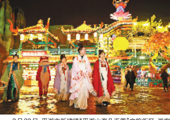
2月23日，平湖市新埭镇“平湖山海几千重”文旅街区，游客们赏灯游园，欢欢喜喜闹元宵。